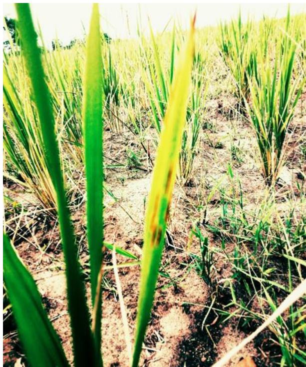
Photo 1 : Symptômes de la cercosporiose sur feuille de riz

plusieurs taches brun-sombres, circulaires ou ovales observées sur la face supérieure des feuilles.