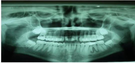
Figure 4 : Panoramique de suivi à 2 ans post opératoire montrant la guérison de l'os