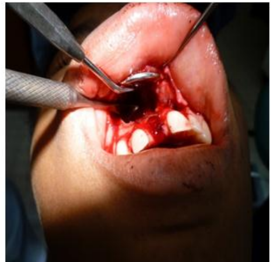
Figure 3: Vue chirurgicale de la cavité opératoire après énucléation et avulsion 11

Le traitement proposé était l'énucléation de la lésion par élévation d'un lambeau de pleine épaisseur, et, du fait de la grande mobilité de la 11, son avulsion a été décidée. La figure 3 présente la cavité opératoire.