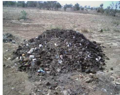
Figure 3 : (de gauche à droite) Espace de repos des bovins et bouse accumulée