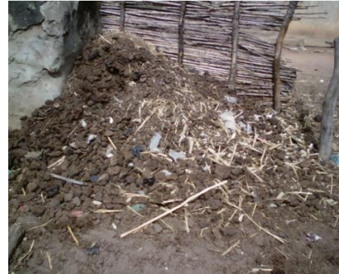
Figure 2 : (de gauche à droite) Enclos des bovins et bouse de vache accumulée