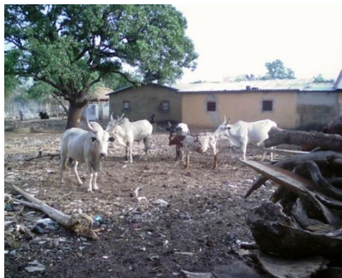
Figure 2: (from left to right) Cow enclosure and cow dung from the enclosure