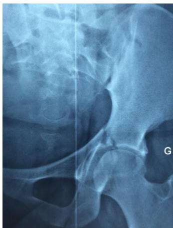
Figure 1 : Fracture transversale associée à une fracture de la paroi postérieure (incidence face)

L'étude concernait 12 patients opérés. Il s'agissait de sept (07) hommes et cinq (05) femmes d'âge moyen 39 ans avec des extrêmes de 18 et 58 ans. Tous les patients avaient bénéficié initialement d'un bilan radiologique spécifique de l'acétabulum ainsi qu'une tomodensitométrie chez 10 patients. Les fractures transversales ou en T associées à une fracture de la paroi postérieure dominaient la série (au nombre de quatre). La figure 1 montre une fracture transversale de l'acétabulum associée à une fracture de la paroi postérieure.