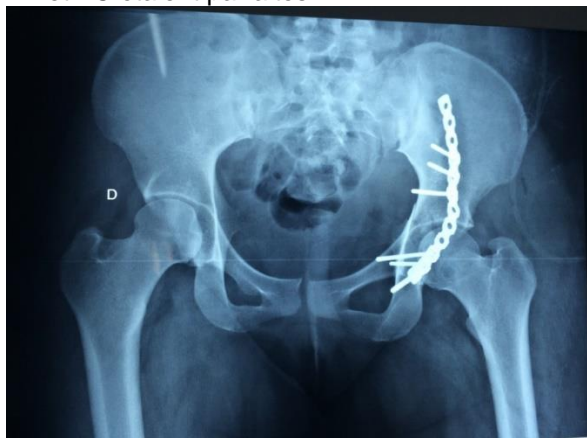
Figure 4 : Ostéosynthèse par plaque (incidence de face)

Selon la qualité de la réduction sanglante, trois (03) patients soit 27,3% avaient une réduction anatomique, cinq (05) soit 45,4% une réduction satisfaisante. La figure 4 montre le résultat post opératoire de l'ostéosynthèse d'une fracture transversale de l'acétabulum associée à une fracture de la paroi postérieure. La réduction sanglante était anatomique, la congruence TT et TC étaient parfaites.