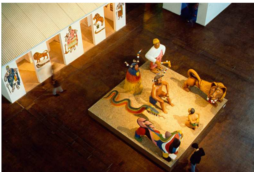
Illustration 3 : Cyprien Tokoudagba Vaudou Zangbeto Legba, et Toxossou , installation, ensemble de 7 sculptures, peintures murales sur un sanctuaire reconstruit, 800 cm de long x 150 cm de large, "Magiciens de la Terre", 1989 au Centre Georges Pompidou

Certains plasticiens béninois ont fait de la thématique vodoun l'unique sujet de leur production. Cyprien Tokoudagba en est l'illustration la plus parfaite. Les masques de Romuald Hazoumé, bien qu'ils fussent réalisés à partir de bidon sont décrit par l'artiste lui-même comme des œuvres possédant une charge sacrée et fortement marqués du signe du vodoun. Le vodoun est aussi un label qui se vend assez bien sur le marché de l'art. On note une forte attente de l'Occident qui depuis Magiciens de la Terre peine toujours à dissocier les arts d'Afrique d'une pseudo magie dont ils seraient auréolés. Aussi les artistes sont-ils tentés selon Maureen Murphy (2014 :33) de répondre aux contraintes imposées par le marché international de l'art avide de "folklore vodoun" et d'"art magico-religieux" ; mais, écrit-elle « si ces plasticiens jouent avec les codes esthétiques de pratiques religieuses ou populaires, ils ne les détournent pas moins pour les désacraliser et produire « autre chose ».