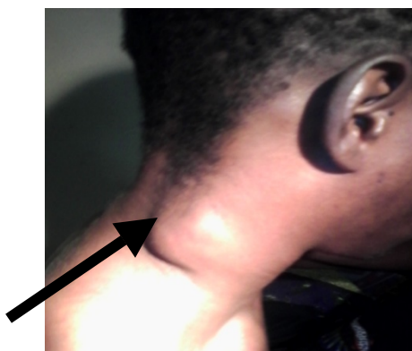
Photo n° 1 : Adénopathie latéro cervicale droite avec tendance à la fistulisation

L'indice de masse corporelle était à 18,28 kg/mm 2 . L'examen physique a confirmé la présence d'adénopathie latéro cervicale droite de consistance molle avec tendance à la fistulisation ( photo 1 ).