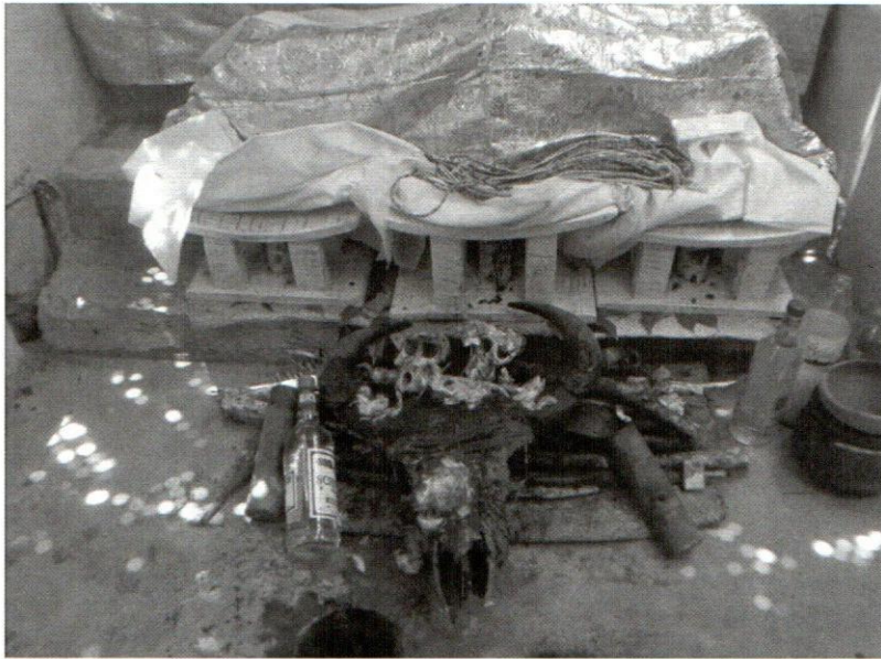
Le Trône des ancêtres.