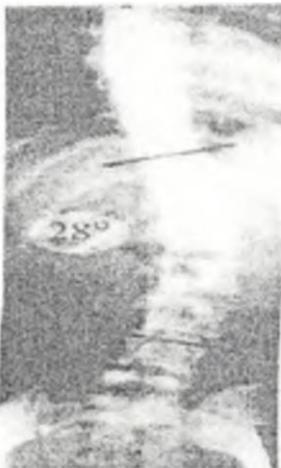
Figure 3 : Déviation latérale dextro-concave du rachis lombaire chez une femme portefaix.

Analyses de déviation latérale Le groupe expérimental avait une valeur moyenne de déviation latérale (Figure 5) significativement plus élevée que le groupe contrôle (Figure 4). Le taux de variation de la valeur moyenne de l'angle de déviation latérale du groupe était de 52.21 %.