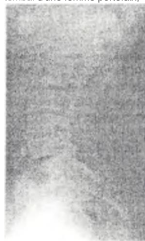
Figure 6 : Disques intervertébraux en usure sur une incidence de profil du rachis tombai d'une femme portefaix,

L'usure des disques intervertébraux lombaires de face et de profil influençait significativement la déviation latérale de la colonne vertébrale ( F < 0,0001 ) avec un taux de corrélation respectivement de 75,50 % et de 91 % ( r < 75,50 % ; r = 91 %)