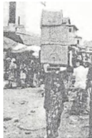
Figure 1 : Femme porteuse portant une

charge céphalique de plus de 100% de sa masse corporelle.