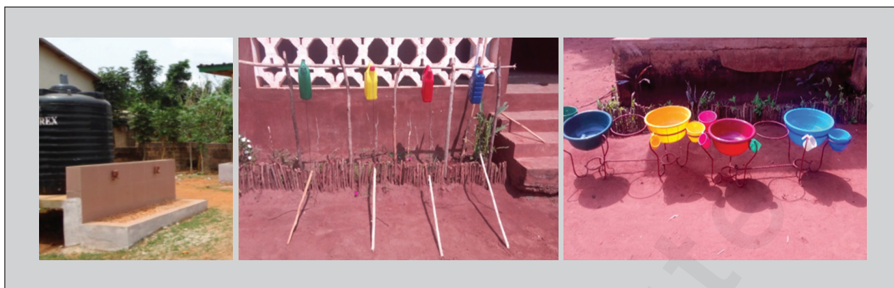
Figure 3. Types de dispositifs de lavage des mains dans les écoles de Lalo et Zè.