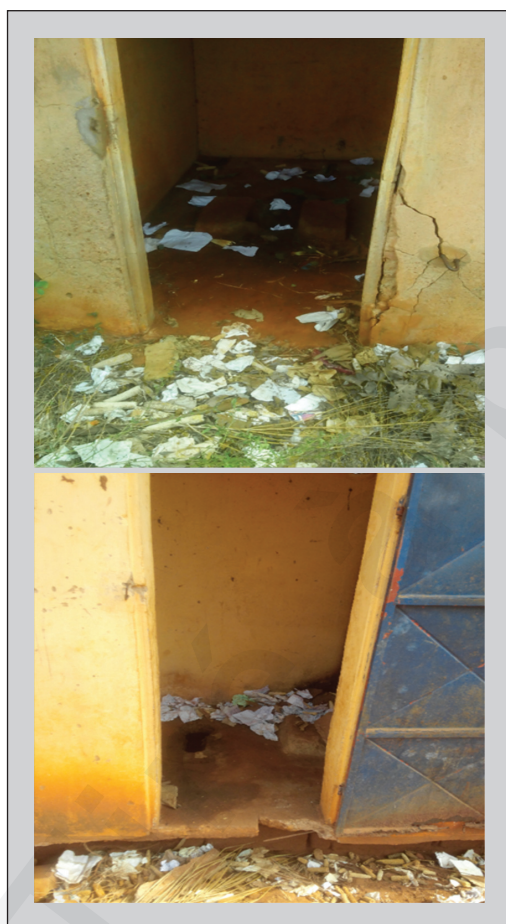
Figure 4. État de quelques cabines de latrines dans la commune de Lalo.