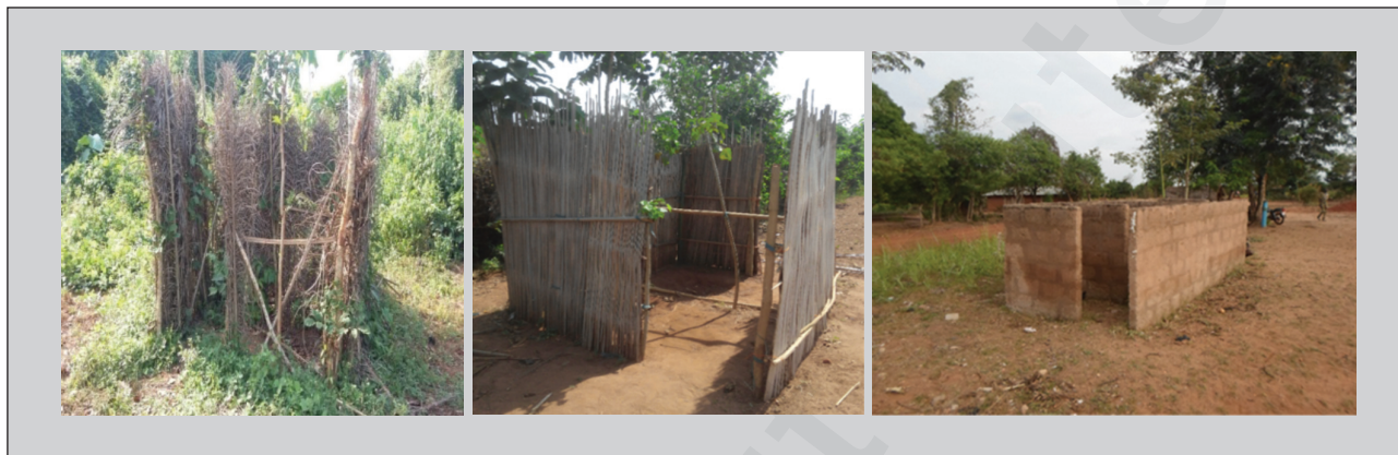
Figure 2. Quelques types d'urinoirs dans les écoles au niveau des deux communes.

D'après les normes éditées par l'OMS et l'Unicef, les toilettes des garçons et des filles doivent être aménagées dans des blocs sanitaires distincts, ou séparées par un mur