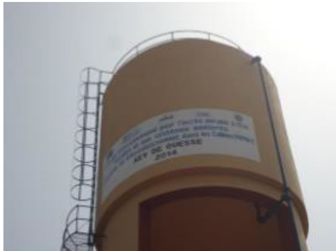
Photo 2 : Vue partielle du château d'eau de Ouèssè construit par le GIC

L'accès à l'eau constitue une préoccupation majeure dans le département des Collines. Ainsi, le GIC apporte sa contribution à travers la réalisation d'ouvrages hydrauliques. Dans ce cadre, le projet PIEPHA-C qui concerne l'eau, l'hygiène et l'assainissement a débouché sur la construction du château d'eau de l'AEV de Ouèssè et des travaux de forages à Offè dans la Commune de Glazoué. La photo 2 montre le château d'eau de Ouèssè.