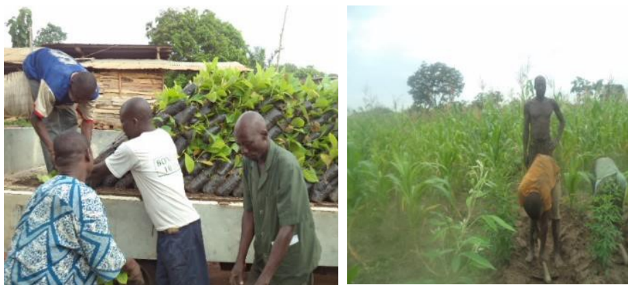
Planche 2 : Chargement des plants pour transport (1) vers parcelle mise en restauration avec le Cajanus associé à la culture du maïs sur sol dégradé (2) à OKEMERE (Arrondissement de Kéré, commune de Dassa-Zoumè)