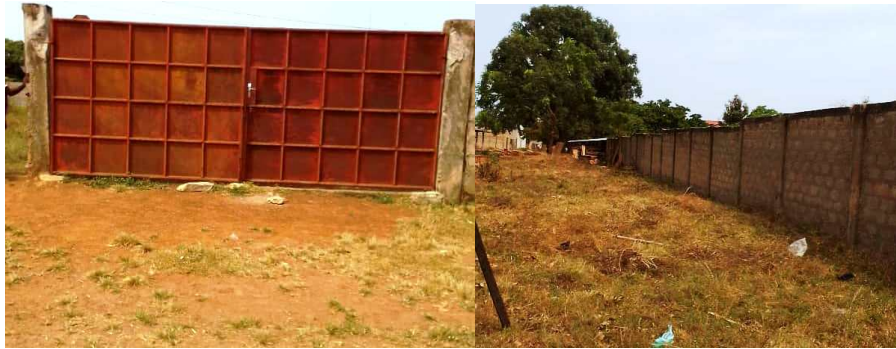
Planche 1 : Vue partielle de la clôture du terrain de football de Gouka construit par le GIC