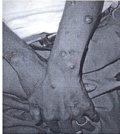
Figure 2 : Cryptococcose cutanée : localisation aux avant-bras

Observation n°2 : Un homme de 45 ans, Béninois, admis en Médecine Interne le 24 octobre 2008, pour altération de l'état général dans un contexte de fièvre au long cours. Au septième jour de son hospitalisation, il présente une éruption cutanée, papuleuse, ombiliquée sur les membres thoraciques puis progressivement disséminée à tout le corps. Les lymphocytes CD4 étaient à 21 cellules par mm 3 . L'examen mycologique des lésions cutanées a isolé le cryptocoque, après coloration à l'encre de chine. Une ponction lombaire a été réalisée systématiquement à la recherche d'une localisation neuro-méningée. L'examen mycologique du LCR est revenu négatif. Le traitement institué était Fluconazole 400mg par jour en intraveineuse lente pendant sept jours, puis relais per os par Fluconazole 400 mg comprimés, en prévention secondaire. Le traitement ARV en cours était : Stavudine, Lamivudine, et Efavirenz. L'évolution est marquée par un statu quo clinique puis le patient sortit contre avis médical le 02/12/2008 et décéda 72 heures après sa sortie.