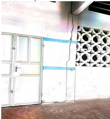
Prise de vue : Adjivessodé, juillet 2023.

L'image est très évocatrice et ne contredit nullement les différents témoignages. La seule consolation au cours de mon entretien avec le directeur concerne l'annonce de leur déménagement très prochain 4 . La rentrée 2023-2024 n'aura donc pas lieu sur ce site. Mais il dit ignorer pour l'instant leur prochaine destination. Il faut reconnaître que c'est un bâtiment neuf construit en face de l'ancien, mais le sol étant hydromorphe, ceci n'a pas permis la stabilité du module de classe qui a subi par endroits des fissures. En 2013, Il fut créé le collège des sourds dont les infrastructures et le mobilier sont en très bon état. Selon le directeur, le matériel de travail est de bonne qualité et en quantité suffisante.