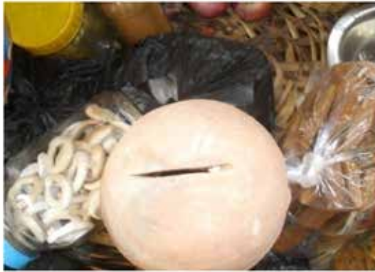
Photo 2 : Caisses servant à la thésaurisation, posée sur l'étalage. août 2016

La caisse (photo 2) est fabriquée artisanalement, avec de la terre rouge, ayant une ouverture large. Il est plus facile d'y mettre des pièces que des billets, mais il est très difficile de les en extraire. La meilleure possibilité de les faire ressortir pour utilisation, est de casser la caisse. Les bénéficiaires agissent ainsi, tous les mois, à l'exception de celles qui l'ont en