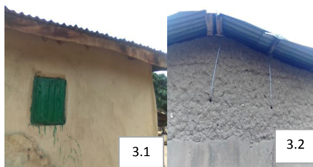
Prise de vues : P. Dedome, Juillet 2020

La population locale, pour lutter contre les dégâts que causent les vents violents, utilise des lambrequins pour borner la toiture des maisons, ensuite elle attache les bois de la charpente aux murs avec des fils de fer pour s'assurer de la solidité de la maison. Les entre-ouvertures des maisons sont hermétiquement fermées pour empêcher le vent de pénétrer dans les chambres, pour décoiffer la toiture de la maison, d'une part et d'autre part, cette pratique sert à lutter contre la fraîcheur de l'harmattan. Enfin, la plupart des ouvertures sont orientées vers l'ouest (odjou alè), afin d'éviter la pénétration des eaux pluviales dans les chambres, sous l'action du vent et, d'endommager les biens. Une autre technique adoptée par la population est la construction des maisons en pente ou en billon, toujours pour que le vent ne décoiffe pas facilement les habitations. La planche 3 illustre les lambrequins et les fils de fer utilisés à Konbom.