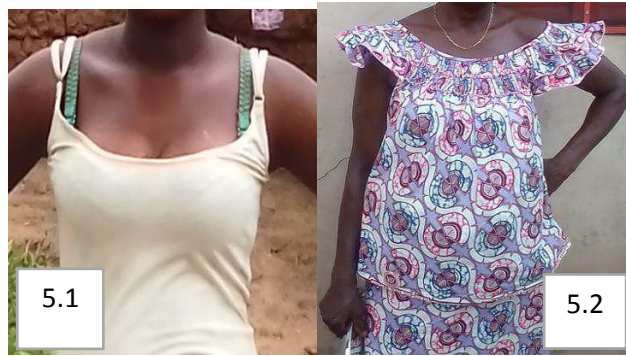
Prise de vue : P. Dedome, juillet 2020