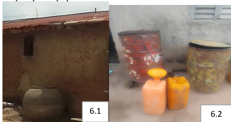
juillet 2020

Les peuples shabè utilisent des contenants pour la conservation de l'eau. Des résultats de la recherche montrent que les citernes (45 %) constituent la méthode de conservation de l'eau la plus répandue dans le milieu suivi des tonneaux (37%) et, les bidons représentent 18 % des moyens. Ces eaux conservées ne sont rien d'autre que l'eau issue des pluies de la saison pluvieuse, utilisée pour la boisson pendant la période sèche. La planche 6 illustre les modes de conservation de l'eau pluviale pratiqués par la population Shabè.