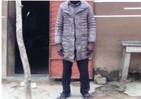
juillet 2020

Pendant les saisons pluvieuses et l'harmattan, certaines personnes portent des vêtements lourds tels que : pull-overs, protège-pluie, pardessus (photo 2). D'autres doublent ou triplent les vêtements (65 % des enquêtés).