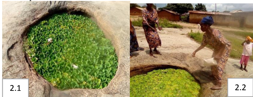
Prise de vues : P. Dedome, juillet 2020

Mais, particulièrement dans le village de Challa-Ogoï, en cas d'absence prolongée des précipitations, les femmes puisent de l'eau dans des bassines qu'elles vont renverser dans « Iton » proférant des paroles incantatoires. Après ce sacrifice, il doit pleuvoir le lendemain ou les jours suivants. La planche 2 présente la rivière Iton.