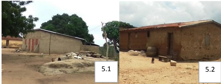
Prise de vues : P. Dedome, juillet 2020

La planche 4 présente des habitations en pente et billon dont les entre-ouvertures sont hermétiquement fermées à Challa-Ogoï.