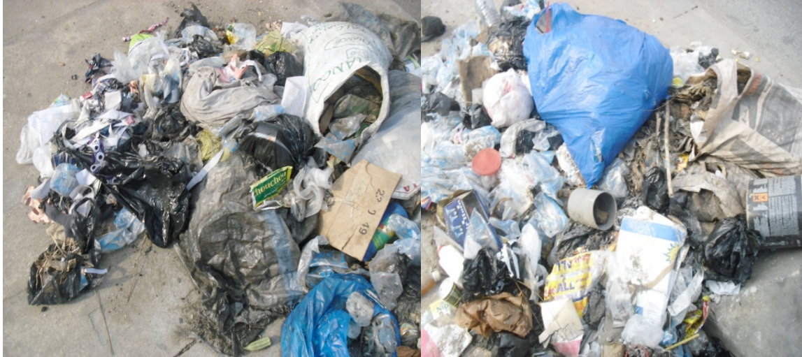
Prise de vue : HEDIBLE, Janvier 2015