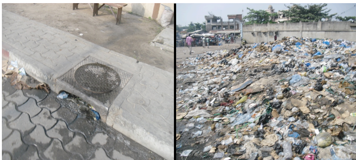
Photo n°1: dépôt d'ordures dans les caniveaux à Agla (HEDIBLE, janv. 2015)

Les habitants ne sont pas conscients des risques environnementaux liés à l'exposition des déchets en plein air. Ils ignorent les maladies respiratoires et les infections microbiennes liées à l'exposition en plein air des déchets ou à leur incinération publique. Ceci se justifie par la disposition sur certaines artères du quartier, des déchets de biens de consommation. Par ailleurs, la plupart des femmes ménagères ne se soucient pas des lieux ou des poubelles dans lesquelles les déchets sont déposés. Il suffit de trouver un sac pour enfouir les déchets et les déposer quelque part ou les jeter simplement en l'état dans les caniveaux ou sur des dépotoirs. Cette situation se justifie entre autres, par le manque de poubelles publiques (photo 1 et 2).