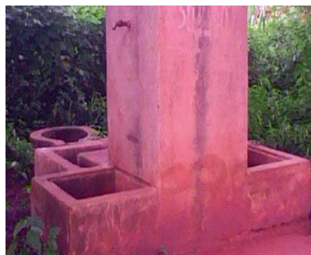
Photo 7 : Installation publique de la SONEB abandonnée à Gbètto (Avogbanan)

erreurs de relevé des compteurs. Ceci se traduit par la résiliation du contrat entre les comités de gestion et la SONEB en ce qui concerne les robinets publics (photo 7) et la coupure définitive des abonnés pour ce qui est des abonnements privés (photo 8).