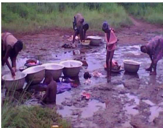
Photo 12 : Utilisation de l'eau du cours d'eau Samion à Todo (Sodohomé)

Il en est de même des populations de Alikpa, Vèhou, Alômè et Sèfanhoué dans l'arrondissement de Sodohomé qui s'approvisionnent au niveau des trous à eau ancestraux (photo 13).