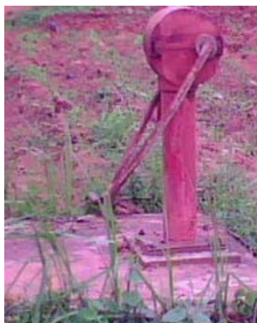
Photo 2 : Forage à pompe à motricité humaine improductif à Lissézoun Centre (Lissézoun)

Le forage du sol est tombé sur des roches si bien qu'il est impossible de poursuivre le travail de réalisation de l'ouvrage hydraulique.