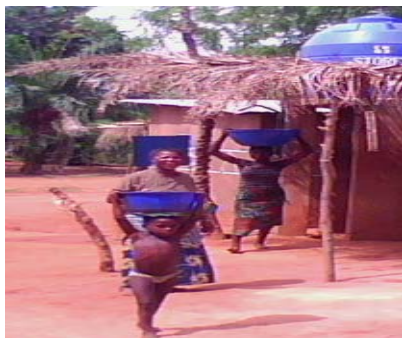
Photo 9 : Approvisionnement en eau de château privé à Zounmè (Lissèzoun)

Cet ouvrage hydraulique est réalisé par un privé il y a moins d'un an pour diminuer aux populations les souffrances en matière de quête d'eau