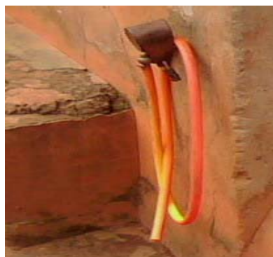
Photo 8 : Coupure définitive de la SONEB dans une maison à Zoungoudo (Agongoïto)

Ce point d'eau public implanté par la SBEE d'alors est coupé pour raison d'incapacité de paiement des redevances par le comité de gestion.