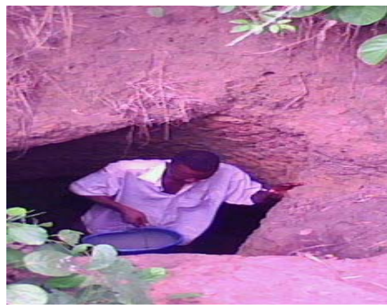
Photo 13 : Trou à eau servant d'approvisionnement en eau à Alikpa (Sodohomé)

Ce cours d'eau prend sa source à Zogbodomey et permet aux populations environnantes de satisfaire leur problème d'approvisionnement en eau. Cette eau sert à tout usage domestique y compris la boisson.