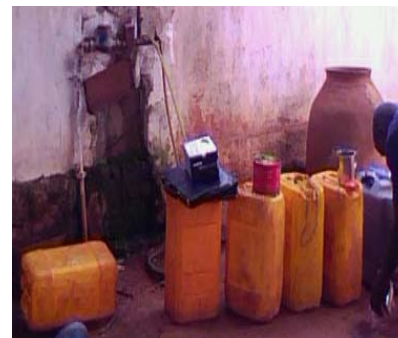
Photo 11 : Approvisionnement en eau de la SONEB par un revendeur à Dakpa (Lissèzoun)

En pleine ville, des ménages s'approvisionnent à l'eau de citernes juste pour réduire les frais d'eau.