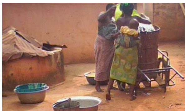
Photo 6 : Femmes se servant d'un tonneau pour transporter l'eau d'une citerne à Zackanmè (Agongointo) Cette eau est vendue à 15 F la bassine de 30 litres et sert à tout usage domestique y compris la boisson.

L'une des difficultés rencontrées par les populations est la distance non négligeable qu'elles parcourent en aller – retour pour s'approvisionner en eau de la SONEB, des châteaux privés, des citernes, des ouvrages d'hydraulique villageoise, des puits traditionnels ou des cours d'eau. Or, le gain de temps, surtout pour les femmes chargées de la corvée d'eau, doit être recherché. C'est l'un des facteurs les plus importants pour l'émancipation des femmes. Cela permet de se consacrer davantage aux soins de leurs enfants, à leurs activités génératrices de revenus et cela améliore de manière évidente leur état nutritionnel (Tomkins et al. 1978). Ce qui les amène à développer des stratégies de transport d'une quantité considérable d'eau en un seul déplacement. C'est le cas des femmes de la photo 6 qui utilisent un tonneau et un pousse-pousse pour transporter l'eau.