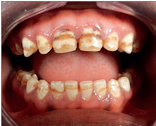
Fig. 4b : Arrondissement de Dassa1 : Élève de 12 ans - fluorose type 7 (indice TSIF). Administrative subdistrict of Tre: 12 year old student - fluorosis type 7 (TSIF index).