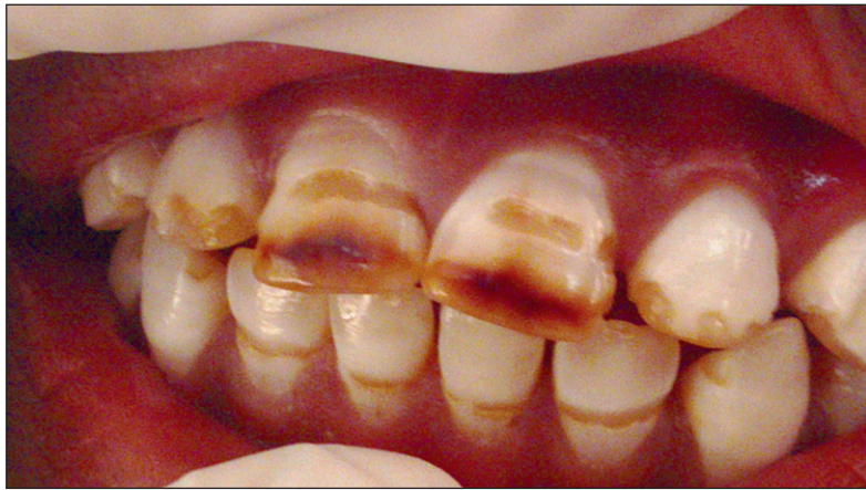
Fig. 4a : Arrondissement de Tre: Écolier de 11 ans - fluorose type 6 (indice TSIF). Administrative subdistrict of Tre: 11 year old student - fluorosis type 6 (TSIF index).