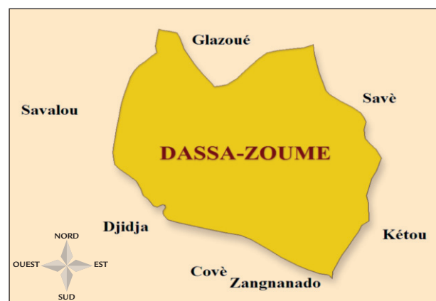
Fig. 1 : Carte montrant le département des collines avec la commune de Dassa. Map showing hills department with the city of Dassa.

Il s'agit d'une étude transversale descriptive et analytique. Population d'étude: Elle est constituée de tous les élèves de 4 à 18 ans inscrits dans les écoles primaires et secondaires publiques des classes retenues de la Commune de Dassa en 2014.