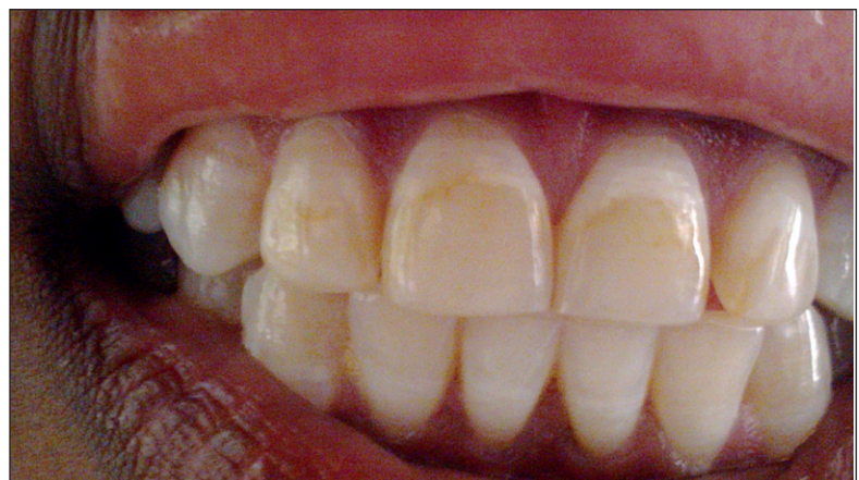
Fig. 3 : Arrondissement de Akofodjoulé : Écolier de 12 ans - fluorose type 2 (indice TSIF). Administrative subdistrict of Akofodjoulé: 12 year old student - fluorosis type 2 (TSIF index).