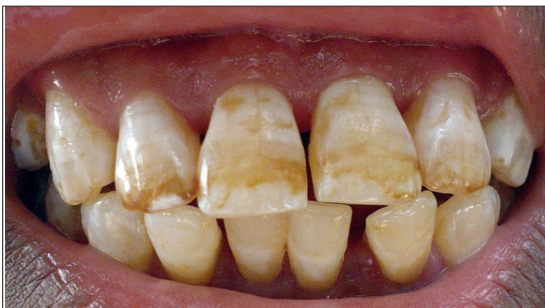
Fig. 2 : Arrondissement de Akofodjoulé : Élève de 15 ans - fluorose type 4 (indice TSIF). Administrative subdistrict of Akofodjoulé: 15 year old student - fluorosis type 4 (TSIF index).