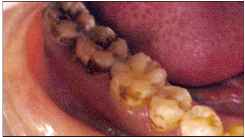
Fig. 5 : Arrondissement de Tre: Élève de 19 ans - fluorose type 6 (indice TSIF). Administrative subdistrict of Tre: 19 year old student - fluorosis type 6 (TSIF index).