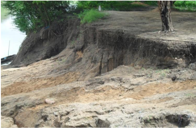
Photo 4 : l'une des berges du fleuve Mono complètement érodée après la grande crue.