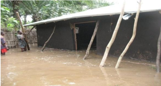
Photo 2 : une habitation menacée d'effondrement parce que, envahie par l'eau à un niveau élevé. Cliché 2014.

Photo 1 : une école de la localité complètement envahie par des eaux agitées par des courants forts comme on l'observe à l'extrême droite de la photo.