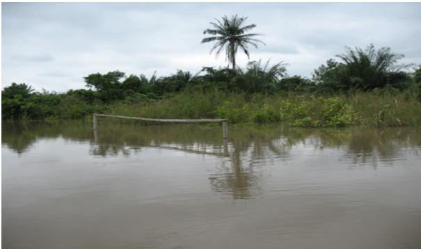
Photo 3 : le niveau des eaux par rapport aux hauteurs des poteaux verticaux, montre leur profondeur sur ce terrain de football dans la localité. Cliché 2014

Sur le plan académique, le constat est désolant car l'inondation des salles de classe entraîne systématiquement la suspension des cours : c'est une mesure de sécurité qui permet de protéger les apprenants contre les dangers liés à l'eau. Parfois, même si les parents font l'effort de regroupement des enfants dans une seule barque, pour les amener à l'école, ce sont les enseignants qui, craignant la noyade parce que ne sachant pas nager, manquent les cours, livrant ainsi les enfants à eux-mêmes.