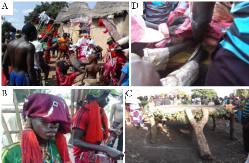
Photo : Les manifestations de la circoncision en milieu waama