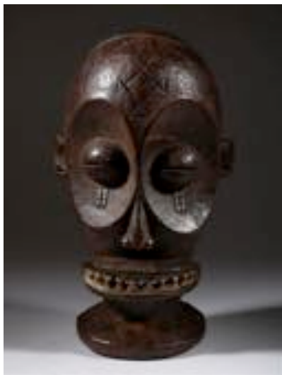
Fig.11 Le masque Mwana Pwo