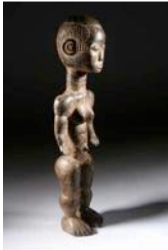
Fig. 9 Sculpture Bété de Côte d'Ivoire ayant reçue des scarifications

conséquences pour l'ensemble de l'Afrique. Alors, comment s'est opéré le transfert de la sculpture à la peinture ?