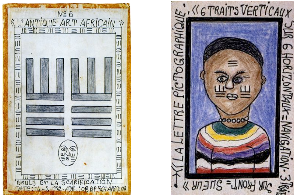
Fig. 13 et 14 Frédéric Bruly Bouabré et les scarifications, deux genres du même artiste.