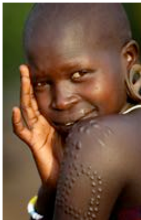
Fig.6- Scarifications au bras d'une femme Mursi d'Ethiopie