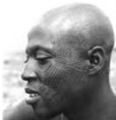
Fig. 1 Scarifications correspondant à la description ci-dessus.

Les scarifications creuses sont l'objet de traits courts, fins, relativement denses ou étendus, isolés ou regroupés formant parfois, un ensemble complexe. On peut les observer chez les Bétamaribè du Nord-Ouest du Bénin, chez les Haoussa dans toute l'Afrique de l'Ouest et chez les Batéké du Congo.