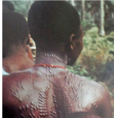
Fig.5- Une femme Goun du Bénin,