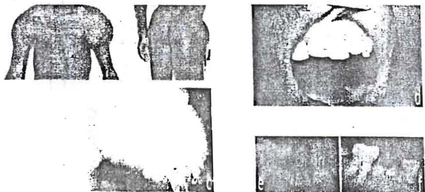
Figure 1. Aspects morphologique de la CFT: (a) and (b) montrent des patients avec de volumineuses tumeurs périarticulaires des épaules et de la hanche; (c) Radiographie de la hanche droite montrant un dépôt calcique dans les tissus mous périarticulaires; (d) altérations: amélogénèse imparfaite; (e) et (f) importante rhyzalyse de certaines dents avec calcification partielle des cavités pulpaires montrant des racines dentaires bulbueuses et courtes

Les aspects morphologiques des patients sont montrés en figure 1 et les données biochimiques résumées dans le tableau 1. Le phénotype décrit dans la CFT est retrouvé chez nos deux patients. L'examen du fond d'œil révèle chez les deux patients la présence