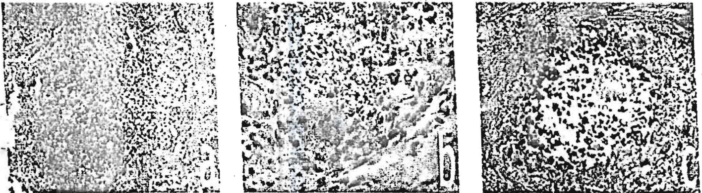
Figure 2 : Microscopie photomicroscopique après biopsie chirurgicale des tumeurs fixées au formol à 10% et enrobage à la paraffine : en a (HE x 25) et b (HE x 400) coloration à l'hématoxyline éosine montrant en a une nécrose et une fibrose du tissu mou avec importante réaction inflammatoire à cellules géantes ; en (c) coloration de Von Kossa (x 100) qui montre un dépôt calcifié au contour irrégulier dans le tissu mou.

La recherche de mutation a révélé chez les deux patients une mutation homozygote c.516-2A>T dans le gène GALNT3. Il s'agit d'une transversion A → T