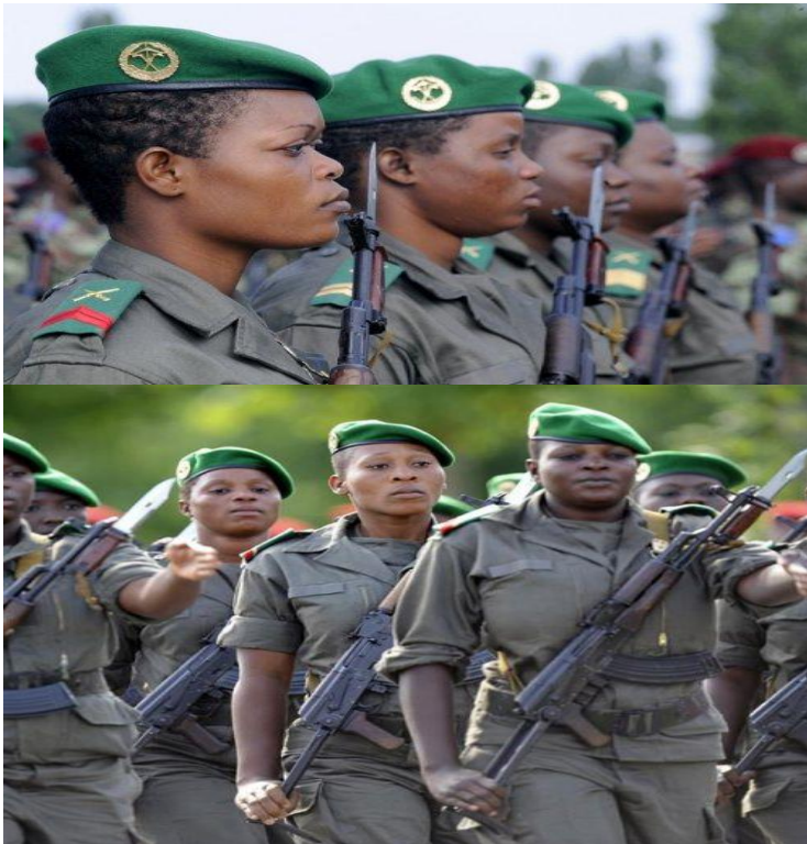
Une armée moderne constituée de femmes

ensemble de cohérence et de finalité hiérarchisées et tend à imposer à lui à travers le résultat des jeux auxquels il doit jouer » (la logique déductive). Indépendamment de l'environnement pertinent et spécifique de l'organisation qui mérite une analyse préalable et objective, c'est au niveau des deux premières logiques (inductive et déductive) que se situe la pertinence de cette théorie dans l'étude du cas de l'institution matrimoniale.