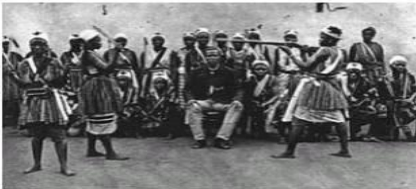
Les Amazones vierges du Dahomey

Sur le plan de la défense des territoires, il existe des systèmes de régulation qui permettent l'intégration systématique des femmes guerrières dans tous les conflits. Les amazones du Dahomey (actuel Bénin), avec un semblant de matriarcat, représentent un ancien régiment militaire entièrement féminin. Elles sont nommées ainsi par les historiens à cause de leur similarité avec les semi-mythiques Amazones de l'ancienne Anatolie.