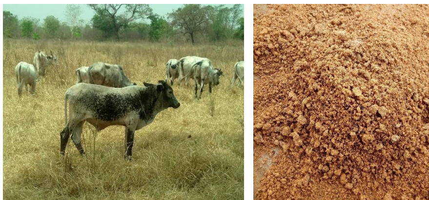
Figure 2 : Pâturage artificiel de Panicum maximum C1 (à gauche); et la drêche sèche de sorgho (à droite)

Le matériel végétal utilisé était composé du Panicum maximum C1 comme aliment de base, et de la drêche sèche de sorgho, comme complément ( Figure 2 ).