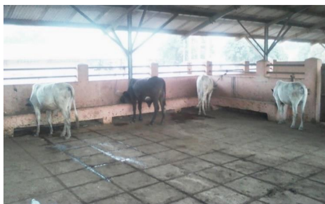
Figure 1 : Taurillons métis (Gir x Borgou) à la FEO

Les animaux étaient logés dans une étable de 7 m sur 14 m soit 98 m 2 le soir au retour du pâturage pour recevoir le complément. Ils ont librement accès à un parc extérieur de 98 m 2 également ( Figure 1 ). Une semaine avant le démarrage de l'expérimentation, le bâtiment, les abreuvoirs et les mangeoires ont été soigneusement nettoyés et désinfectés au moyen de l'eau de javel à la dose de 150ml dans 5L d'eau. Tous les bovins utilisés ont été vaccinés contre la trypanosomiase en utilisant le Vériben ND dont la molécule est le diminazène. Une couverture antibiotique à l'Oxytétracycline (20 %) longue action leur était administré. Les animaux ont également subi des déparasitages interne et externe par administration du Tin ND dont la molécule est l'ivermectine. En cas d'irrégularité, des soins étaient apportés aux animaux.