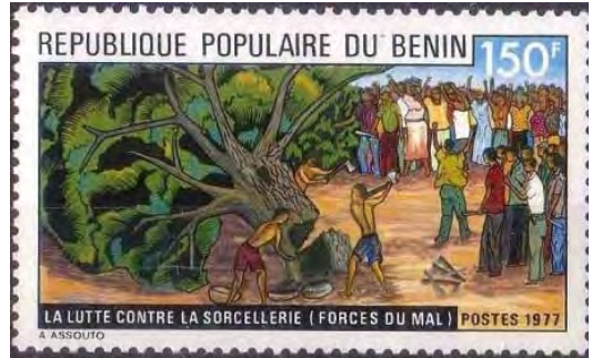
Illustrations 16 et 17 : Lutte contre la sorcellerie (Forces du mal).