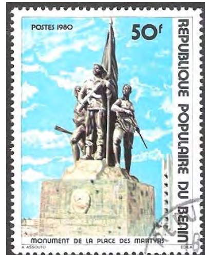
Illustrations 18 et 19 : Commémoration l'échec de l'agression aérienne du 16 janvier 1977.