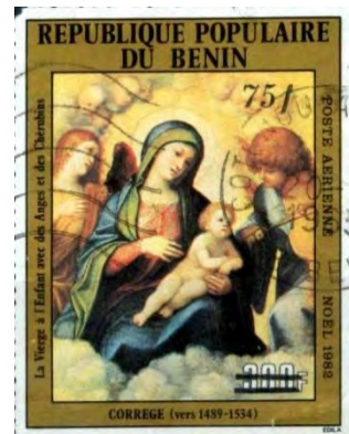
Illustrations 21 et 22 : représentations bibliques pour Noël 1982.