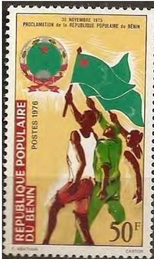
Illustration 08 : Vignette postale représentant la proclamation de la République populaire du Bénin.

représenter les épis de maïs. L'usage du doré n'est pas certainement innocent. La couleur or est une allusion directe au métal précieux et symbolise la richesse et la fortune. Il est donc fort possible que le régime révolutionnaire ait attribué à la production agricole la mission première de faire la fortune et le développement du pays. Une importante réforme agraire est mise en place et conduite par l'État qui vise aussi un développement de l'industrialisation.