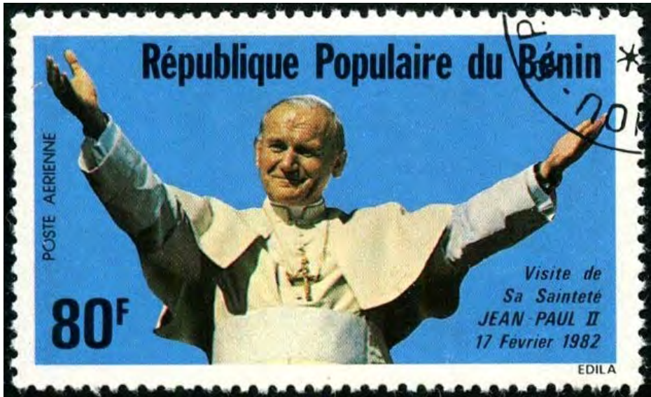
Illustration 20 : Commémoration de la visite du Pape Jean-Paul II au Bénin.

Source : http://www.colnect.com/fr/stamps/years/country/4223-B%C3%A9nin .