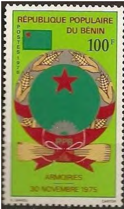
Illustration 07 : Vignette postale représentant les armoiries de la République populaire du Bénin émise en 1975.