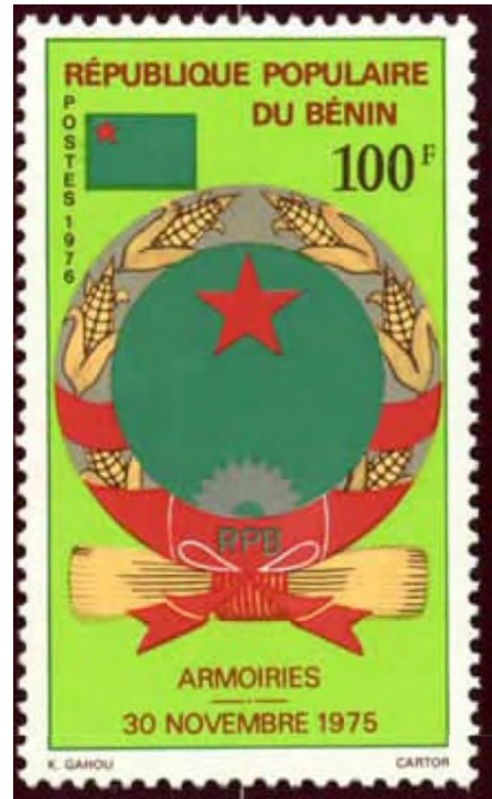
Illustration 07 bis : Vignette postale représentant les armoiries de la République populaire du Bénin émise en 1976.