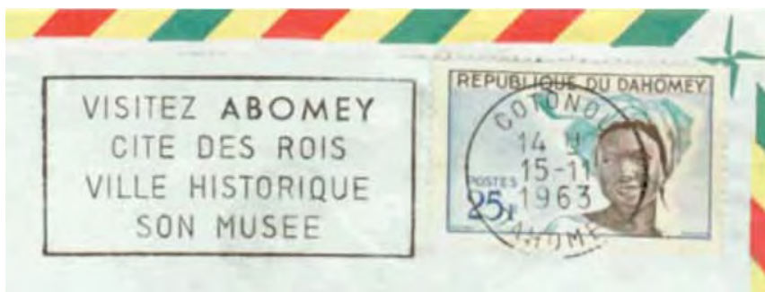
Illustrations 02, 03 et 04 : Oblitérations mécaniques à but touristique.