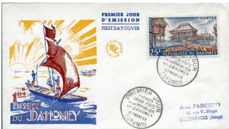
Illustration 01 : Enveloppe premier jour émise par la République du Dahomey.

Au centre de l'enveloppe une autre inscription ainsi qu'un cachet imprimé rappelle qu'il s'agit de la première émission postale. Le texte de l'inscription porte la mention PREMIER JOUR D'EMISSION/ FIRST DAY COVER. Le cachet imprimé reprend la même inscription et comporte en son centre les initiales FDC pour First Day Cover (Illustration 01).