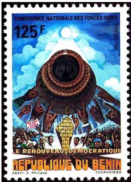
Illustration 24 : Commémoration de la Conférence Nationale des Forces Vives de février 1990.