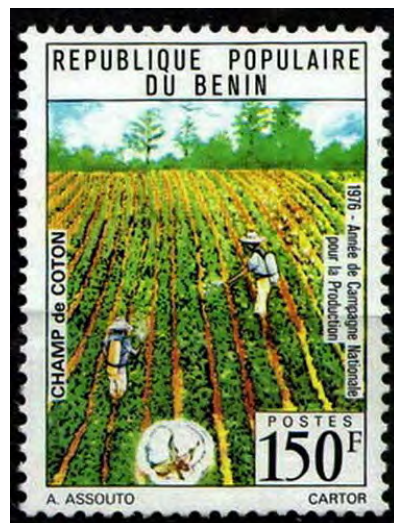
Illustrations 11, 12, 13 et 14 : Campagne Nationale pour la Production.