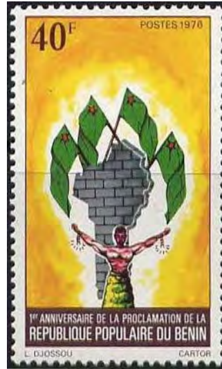
Illustration 09 : commémoration du premier anniversaire de la proclamation de la République populaire du Bénin.

Source : http://www.histoire-et-philatelie.fr/pages/005_decolonisation/1260_ex-colonies_6.html#repppubenin .