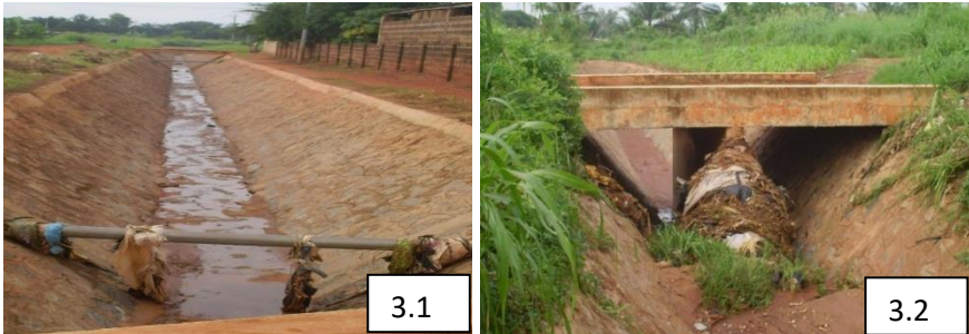
Planche 3 : Collecteurs CP_B-E1_3 (3.1 et 3.2) réalisés par la DANIDA à Sèhouèho