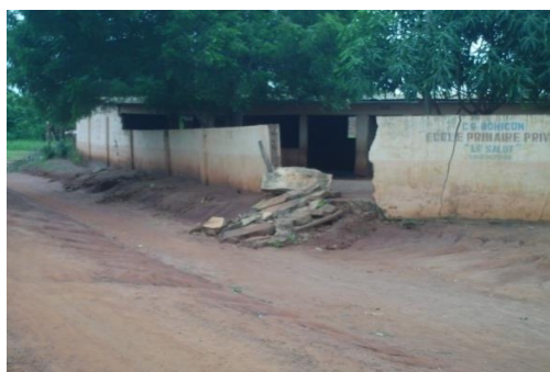
Prise de vue : Adjakpa, juin 2020

Sur la photo n°1, on peut observer la clôture d'une école, érigée à côté d'un couloir d'eau, et qui s'est effondrée suite à sa fragilisation provoquée par la stagnation des eaux d'inondation. Elle a subi également le phénomène de déchaussement qui a induit à un déséquilibre, d'où son écroulement. Les conséquences au plan humain pourraient être énormes, surtout qu'il s'agit d'un lieu de regroupement de plusieurs dizaines d'enfants dont la vie serait en danger.