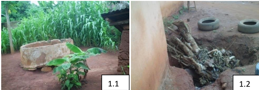
Planche n°1 : Une Citerne (1.1) et un puits (1.2) transformés en de réceptacles d'eaux de ruissellement, respectivement à Adamè (Gnidjazoun) et à Houndonho