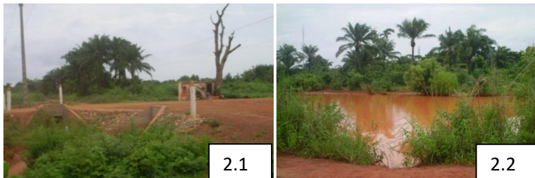
Planche n°2 : Ponceaux de déviation des eaux de ruissellement au carrefour Lègbaholi (2.1) et Bassin d'eaux de ruissellement à Dakpa (2.2)