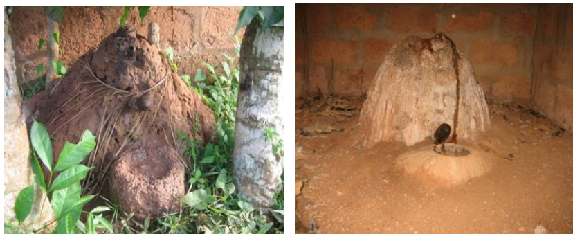
Quelques photos de lègba (Abomey, Bénin)