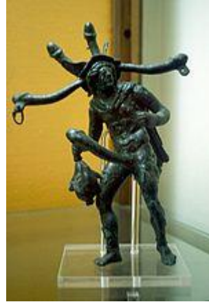
Tintinnabulum (en) Polyphallique en bronze (Barton, 1996 ; Green, 1994); dont chaque branche-pénis porte un anneau servant de porte-cloche (Wikipédia, 2021)

Le symbole est trouvé ailleurs qu'au Bénin ; déjà en Gaule Romaine, le dieu Celte identifié au dieu Mercure, est parfois représenté avec trois pénis (images ci-dessous).