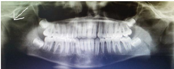
Fig 2 : radiographie panoramique pré opératoire

L'examen radiologique révèle une fracture condylienne gauche.