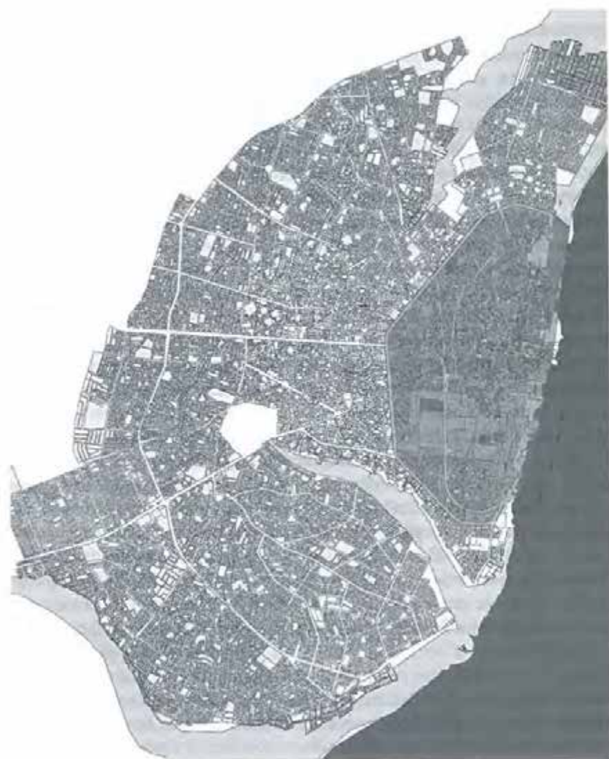
Carte 1 – Parcellaire de Porto-Novo avec délimitation du périmètre