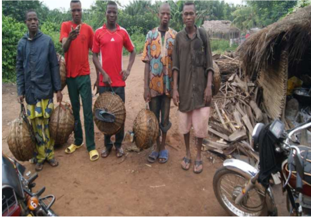
Photo 1 : pratiquants d'akadja Prise de vue : Togbé T., Juillet 2013.

La pêche à la main, communément appelée " ALOTOE ", consiste tout simplement à pêcher à la main. Cette pratique de pêche a lieu à Dessa et Véha, deux villages de l'Arrondissement de Houin, Commune de Lokossa. Elle ne se fait pas individuellement mais de façon collective comme l'indique la photo 1 :