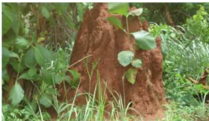
Photo 2 : Termitière à Banigbé

La photo 1 présente une image de la plante Tridax procumbens (Taliu), communément appelée Glinsiman en goungbé. C'est une plante indicatrice de la fertilité du sol. Selon les paysans lorsqu'elle pousse sur un sol, cela présage d'une disponibilité en quantité d'éléments nutritifs dans le sol. Il est un indicateur très utilisé par les paysans pour juger bon de l'aptitude culturale des terres. Les combinaisons des différents indicateurs permettent aux producteurs de déterminer les spéculations à produire. La photo 2 montre un autre élément reconnu à 100 % par les populations de Banigbé comme étant un indicateur de la fertilité des sols dans leur milieu.