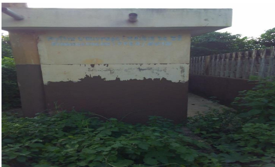
Photo 5 : Latrines publiques abandonnées par les usagers du marché de Koundokpoé

Les latrines publiques construites sur financement du Programme Pluriannuel d'appuis au secteur de l'Eau et de l'Assainissement (PPEA) n'ont pas été mis en usage depuis leur construction en 2012. Les portes sont restées fermées. Ainsi, comme mentionné précédemment, sur les 7 latrines publiques réalisées, seules deux (2) de celles-ci sont encore en usage. Il s'agit d'un bloc de latrines de quatre (4) cabines, situé au côté sud-est du marché de Tangbo-djévié et de celui de trois (3) cabines, situés au nord du marché de Koundokpoé. Le premier est construit sur financement PPEA et le second a été construit grâce à une mobilisation locale et l'aide des ONG locales. En somme sur les 7 blocs de latrines publiques réalisés sur les sites des marchés de Zè, 71,43% ne sont pas utilisés par les populations. Cette situation paradoxale amène à s'interroger sur les causes de l'abandon de ces latrines publiques.