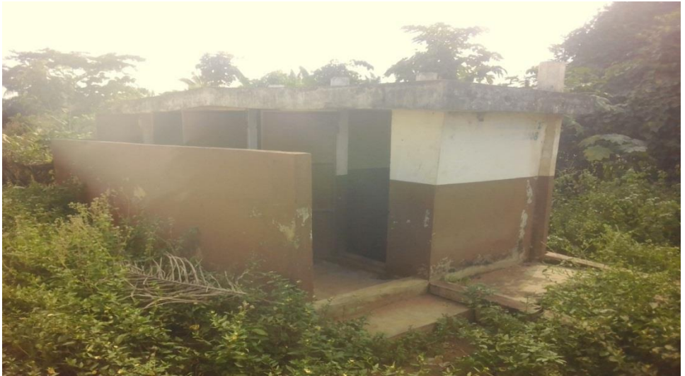
Photo 1 : Latrines publiques abandonnées par les usagers du marché de Sédjè-Dénou

sur les sites des marchés de la Commune de Zè dont cinq (5) sont abandonnées. Au marché de Sédjè-Dénou, on retrouve un bloc situé derrière le "Tolègba" du côté Est. C'est une série de quatre cabines individuelles groupées en un seul bloc (photo 1).