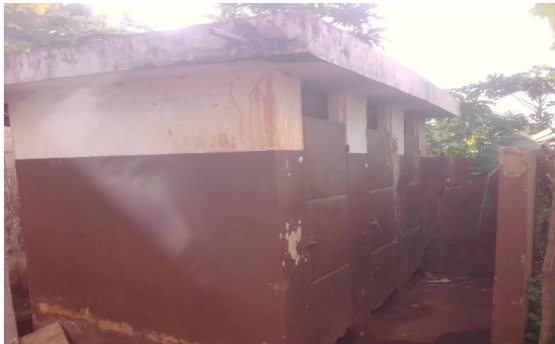
Photo 2 : Latrines publiques abandonnées par les usagers du Parc des Zem à Zè-centre