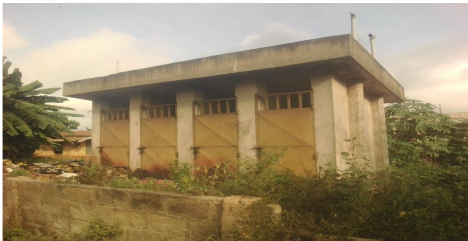
Photo 6 : Portes des cabines fermées entraînant l'abandon des nouvelles latrines publiques du marché de Zè-centre

Selon les usagers du marché de Zè centre, la non-utilisation des latrines publiques (photo 5) s'explique par l'inaccessibilité des cabines. En effet, depuis la remise des clés par la Mairie de Zè, les autorités locales ne savent pas qui détient les clés. Les démarches faites dans la localité pour retrouver la personne sont restés improductives. Du coup, les cabines des latrines publiques sont restées inaccessibles jusqu'aujourd'hui (photo 6).