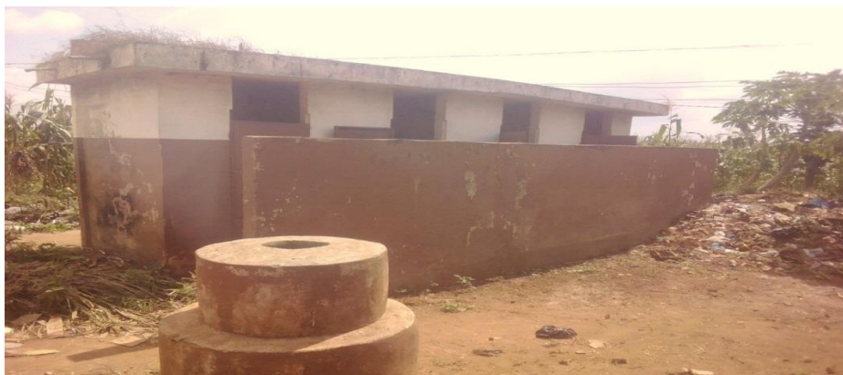
Photo 7 : Latrines publiques encore en usage dans le marché de Tangbo-Djévié

du marché (photo 4). Selon les usagers, l'abandon de ces latrines s'explique par le « remplissage des fosses ». Les fosses des anciennes latrines publiques n'ayant pas été vidées et profitant de la présence de nouvelles latrines construites sur financement PPEA (photo 7), les usagers ont abandonné lesdites latrines publiques. Cette version des faits est confirmée par le gestionnaire du marché et certains agents de la mairie.