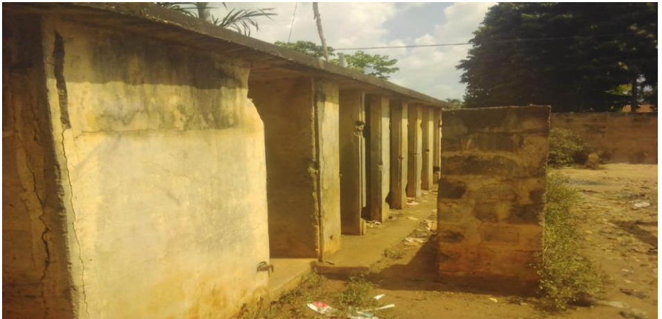
Photo 4 : Latrines publiques abandonnées après remplissage au marché de Tangbo-djèvié

Du côté du marché de Tangbo-Djèvié, on retrouve un bloc de latrines encore hors d'usage dans l'angle sud-ouest. Il s'agit d'un bloc de sept (7) cabines construites sur fonds propres du comité de marché, selon le gestionnaire du marché. La photo ci-dessous montre les sept cabines construites sur fond propre par les usagers du marché.