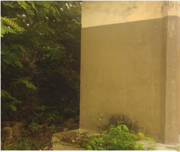
Photo 9 : Insalubrité autour des latrines publiques du marché de Zè-centre arc