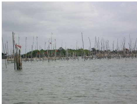
Photo 1 : Espace sacré et protégé autour du fétiche d'« Avlékété-tin » dans le lac Ahémé

Aujourd'hui, cette pratique ancestrale (photos 3) se généralise et déjà 35 Avlékété-tins sont installés sur le lac Ahémé. Du fait de sa productivité, plus de 88 % de la population souhaite 2 à 3 Avlékété-tins au lieu de un par village lacustre. Cette pratique consiste à la mise en défens de certaines parties du lac (figure 6) appelée Avlékété-tin (enclos piscicole dédié à la divinité Avlékété ). Elle permet de restaurer les ressources halieutiques pour une gestion traditionnelle durable (Photo 1).