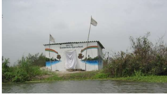
Photo 2 : Temple du fétiche Dan , protecteur du lac Ahémé à Couffonou Prise de vue : Amoussou et Totin, février 2006

généralisent et sollicitent l'esprit adaptatif des populations.