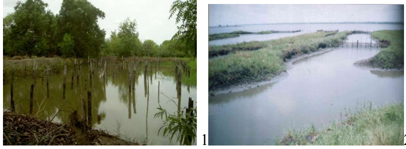
Planche 1 : Trou piscicole traditionnel communiquant avec la lagune côtière à Gbéhoué-Pédah (1) et avec le lac Ahémé à Guézin (2).