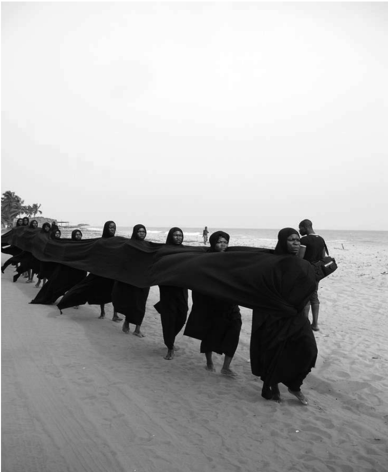
Fig. 1 : Longue procession de thrène ( À la poursuite du temps , 2014)

classiques de l'entreprise esclavagiste : l'arrivée des premiers Blancs, la conquête par le biais de la séduction puis de la répression des Noirs, la constitution d'une armée locale à la solde des Blancs, l'achat des premiers esclaves et leur embarquement pour l'ailleurs, etc. Le défi est donc immense pour la soixantaine d'acteurs, engagés dans ce mime déambulatoire de plus de deux heures. Le nombre ahurissant de personnes sur la scène donnait l'impression d'une foule, d'une profusion d'êtres aux prises avec des destins collectifs et individuels. En se référant au nombre de comédiens impliqués dans chaque action, on peut distinguer deux types de jeu : les jeux collectifs (chorégraphies d'ensemble, longue procession silencieuse significative d'une douleur extrême des Noirs) et les jeux individuels (joie délirante du Noir qui a reçu un cadeau du Blanc).