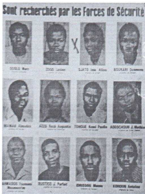
Photo 2 : Avis de recherche contre des citoyens.

La traque des frondeurs est l'une des caractéristiques du régime qui fait souvent placarder la photo de ses « ennemis » dans le quotidien public d'information et demande aux populations de les déloger. En voici deux exemples.