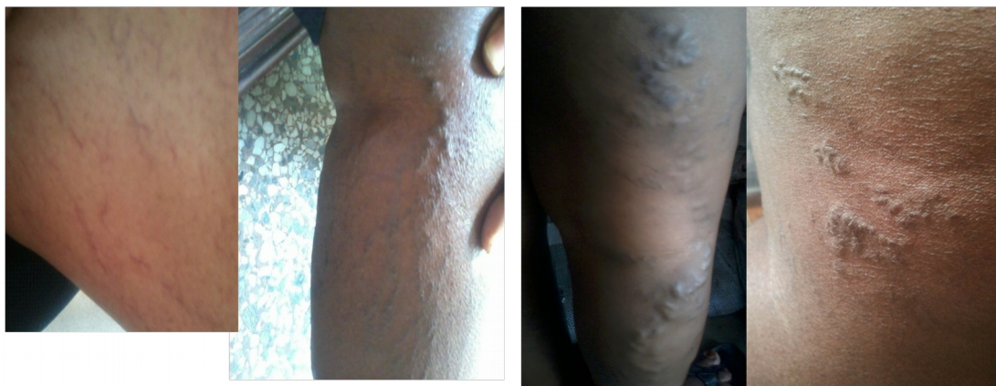
Télangiectasie V. Réticulaire V. Tronculaire Perlesvariéuses