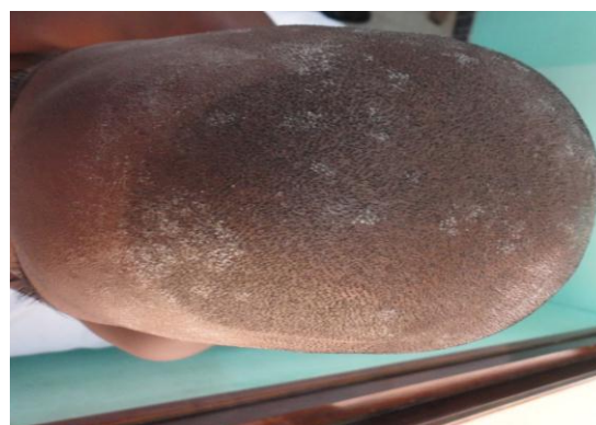
Figure 2 : Teigne chez un grand enfant

Quelle que soit l'étiologie de l'onychomycose, les femmes étaient plus touchées ( p = 0,0000 ), soit 82% de l'ensemble contre 18% chez les hommes. La tranche d'âge la plus touchée était celle comprise entre 31 et 45 ans ( p = 0,0048 ), soit 38%. Les enfants de 0-15 ans étaient les moins atteints, soit 3%. Nous avons enregistré 52 cas de teigne (Figure 2), soit 5% de l'ensemble des mycoses superficielles.