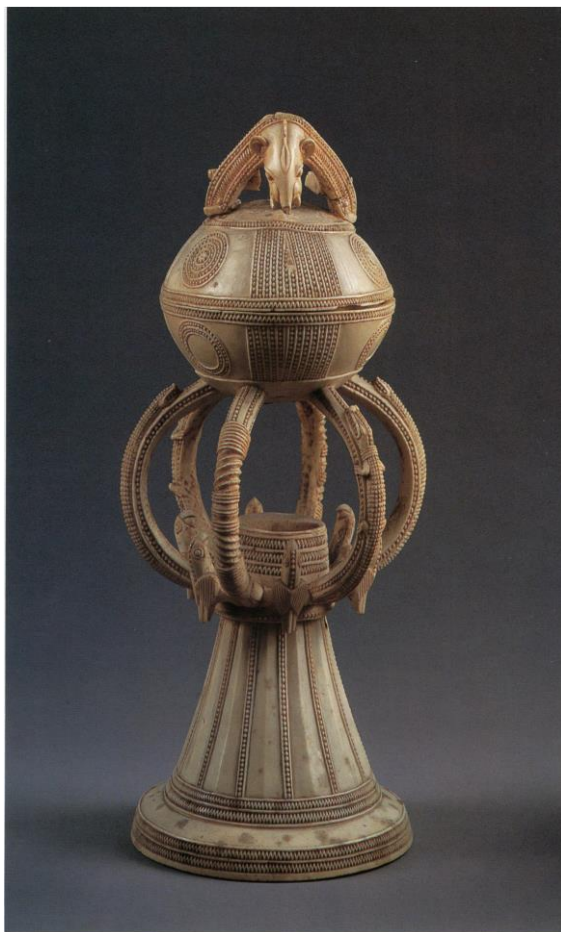
Fig. 1 : Salière, Sapi-Portugaise, datant d'environ 1490-1530. Ivoire, 29cm.