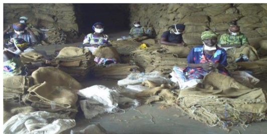
Photo1 : les femmes de la commune de Parakou préparant des sacs pour le stockage du maïs

Nos observations ont montré l'existence des stocks dans les magasins.