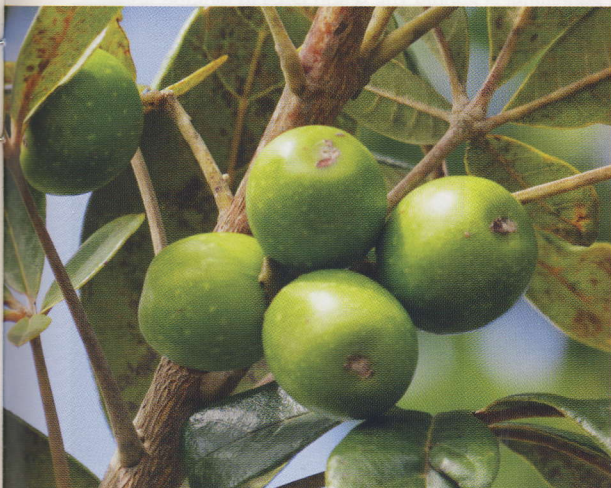
◀ Vitex doniana Sweet

Chetioui S. (2010) Structures et propriétés physico-chimiques de substances colorantes de synthèse , Mémoire de Magister, Université Mentouri Constantine, 105 p.