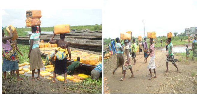
Photo 1 : Chargement et déchargement des bidons d'essence dans les barques