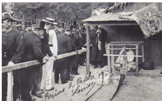
Fig. 2- Photographie d'un africain exposé dans une cage à Reims en octobre 1903.

À Berlin, c'est à la Berliner Gewerbe-Ausstellung , devenue le Deutsches Kolonial museum , qu'a eu lieu l'exposition ethnographique en 1896. À Bruxelles, c'est à Tervuren qu'en 1910, les congolais furent exhibés. Tous ces lieux sont des marqueurs d'histoire de l'art d'abord, pour les biens culturels et ensuite, les arts d'Afrique. Autre fait marquant, ces "expositions" s'organisaient avec la bénédiction des États. C'est le cas de la France où, pour l'exposition universelle de 1889, c'est le gouvernement de Carnot qui assure le recrutement et la sélection des exhibés. En 1891, alors même qu'il préparait une expédition contre le royaume d'origine de celles-ci, le président de la République Sadi Carnot assiste lui-même à l'exhibition des Amazones du Danxomè. Pire, des hommes sont mis en cage et de gens de "bonne renommée" pouvaient passer les visiter pendant une foire officielle comme sur l'image ci-dessous (Fig. 2).