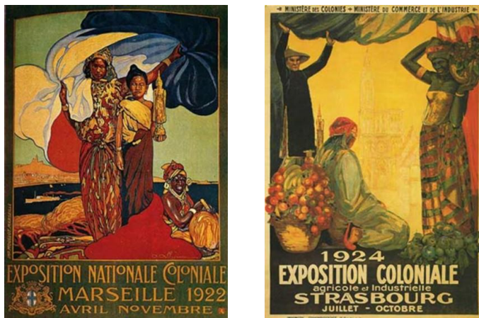
Fig. 2- L’évolution de la représentation des peuples colonisés est notable ici, même si le fond des images laisse encre perplexé.

On peut noter cette avancée sur tout le territoire français, du Nord au Sud, au cours des expositions coloniales, par exemple, de Marseille en 1922 et Strasbourg en 1924.