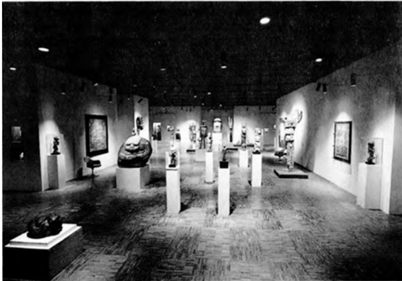
FIG. 5. — Exposition « Chefs-d'œuvre du musée de l'Homme », 1965.

Du côté des institutions muséales, le Trocadéro devrait se renouveler. La nomination de Paul Rivet en 1929, chaire d'anthropologie et son Adjoint Georges-Henri Rivière permet d'achever le processus de création du musée de l'homme et favoriser une nouvelle muséographie décentrée de l'esthétique du trophée. Georges-Henri Rivière, écrira Murphy : « ...veut placer l'individualité de l'objet au cœur du processus d'exposition, rompre avec le principe d'accumulation et « informer » l'objet par le document ... » 387 . Cette dernière idée est à l'origine des missions scientifiques ethnographiques et de la deuxième phase d'approche de l'art africain par les ethnologues.