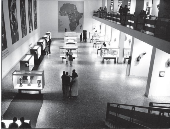
Fig. 4- Musée dynamique de Dakar, 1966. Exposition « Art nègre : sources, évolutions, expansion ». Extrait de On ne peut nier longtemps l'art nègre , p. 155.

Enfin, le second Festival mondial des arts et de la culture à Lagos en février 1977. Le festival a réussi à agiter le récurrent, mais intéressant problème de la légitimité de la patrimonialisation des biens culturels et surtout, son impact sur la production actuelle. Tout ceci-a-t-il favorisé la réappropriation des savoirs ?