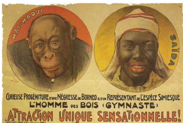
Fig. 1- Image montrant la similitude entre africain (espèce simiesque) et un singe. Extrait du site www.deshumanisation.com

À Berlin, c'est à la Berliner Gewerbe-Ausstellung , devenue le Deutsches Kolonial museum , qu'a eu lieu l'exposition ethnographique en 1896. À Bruxelles, c'est à Tervuren qu'en 1910, les congolais furent exhibés. Tous ces lieux sont des marqueurs d'histoire de l'art d'abord, pour les biens culturels et ensuite, les arts d'Afrique. Autre fait marquant, ces "expositions" s'organisaient avec la bénédiction des États. C'est le cas de la France où, pour l'exposition universelle de 1889, c'est le gouvernement de Carnot qui assure le recrutement et la sélection des exhibés. En 1891, alors même qu'il préparait une expédition contre le royaume d'origine de celles-ci, le président de la République Sadi Carnot assiste lui-même à l'exhibition des Amazones du Danxomè. Pire, des hommes sont mis en cage et de gens de "bonne renommée" pouvaient passer les visiter pendant une foire officielle comme sur l'image ci-dessous (Fig. 2).