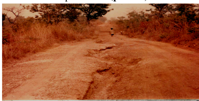
Photo 1 : Incision profonde sur la route Monkpa-Savalou

Face à ces problèmes, le producteur n'arrive pas à vendre son produit à bon prix. Il subit des pertes énormes malgré les efforts consentis. Ainsi, dans les fermes, nombre de paysans se donnent à la culture de subsistance. Parfois des bailleurs de fonds ou des ONG organisent les paysans à produire un type de culture donné et achètent les produits à bas prix à leur profit. Tout ceci maintient notamment les ruraux dans une situation de pauvreté et la durée de vie des regroupements des producteurs est souvent éphémère car les aides sont très intéressées.