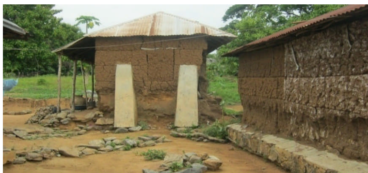
Photo 4 : L'état de ses habitations délabrées exprimant le niveau de pauvreté des habitants. Source : Cliché MAKPONSE, Mai 2013

On observe ainsi dans la commune de Savalou une force négative entre la trilogie Economie-Environnement-Société. Face à toutes ces difficultés, l'espérance de vie n'est pas élevée. Elle est de cinquante cinq (55) ans (INSAE, 2002). En effet, la pauvreté des populations favorise les dégradations sociale, économique et environnementale. Il urge alors de trouver des approches de solutions pour un développement humain durable.