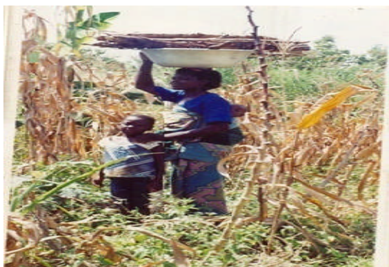
Photo 2 : Une femme avec un enfant au la tête des sacs de au dos, son aîné devant elle et vers la maison porteuse de fagots de bois

la mécanique, la couture, le dépannage des radios et télévisions, l'horlogerie, etc., qui n'arrivent pas souvent à nourrir son pratiquant. Il se développe une culture hybride source de plusieurs contradictions avec ses corollaires d'adultères, de prostitution, de conflits fonciers, de la multiplicité des partis politiques sources de trahison et d'opposition sans merci entre les membres d'une même famille à cause des intérêts particuliers et égoïstes. L'insécurité est devenue grandissante avec des braquages, des vols à mains armées des récoltes et du petit bétail, etc. Ceci augmente la pénibilité des activités agricoles. En effet, pour être à l'abri des vols des récoltes, le paysan est obligé de transporter ses produits de la ferme qui se situe en moyenne à une quinzaine de kilomètres de la maison souvent par le portage par les femmes et par le vélo et la moto dans une certaine mesure par les hommes ( photos 2 et 3 ).