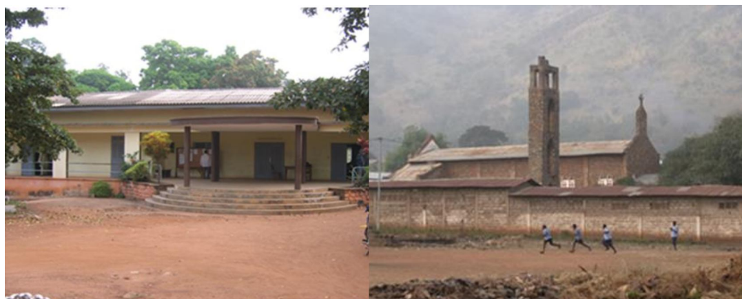
Planche 1 : Exemples de réalisations de l'administration coloniale dans la ville de Savalou (à gauche l'ancien bâtiment de la mairie et à droite l'ancien bâtiment de l'église catholique)

Deux de ces réalisations peuvent être observées sur la planche 1 ci-dessous.