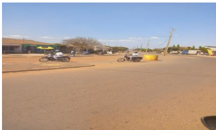
Photo 2 : balises au niveau du carrefour st Antoine pour retrait de fond Prise de vue : T.S. MODIBO KARIM. 2020