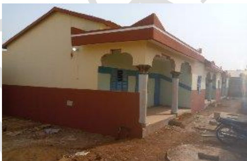
Photo 1 : Chantier en construction à Djougou : Maison type de migrants pour location

La photo 1 illustre un type de construction réservée aux séjours d'une catégorie de personnes qui le temps de passage dans la localité n'est pas souvent longue et qui veulent rester loin des regards des hôtels de la place. D'aucuns font recours à ses constructions quand le séjour est un peu prolongé comme c'est souvent le cas dans le cadre des recherches de terrain avec une mobilisation de plusieurs personnes. Dans ces cas, l'hôtel n'est pas la destination par excellence de cette catégorie de personnes qui préfèrent séjourner dans ces types de constructions. Cela laisse transparaître l'avantage de la migration.