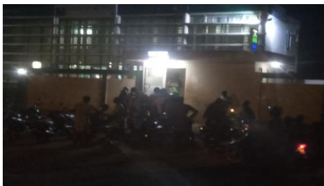
Photo 3 : Présence au guichet BOA