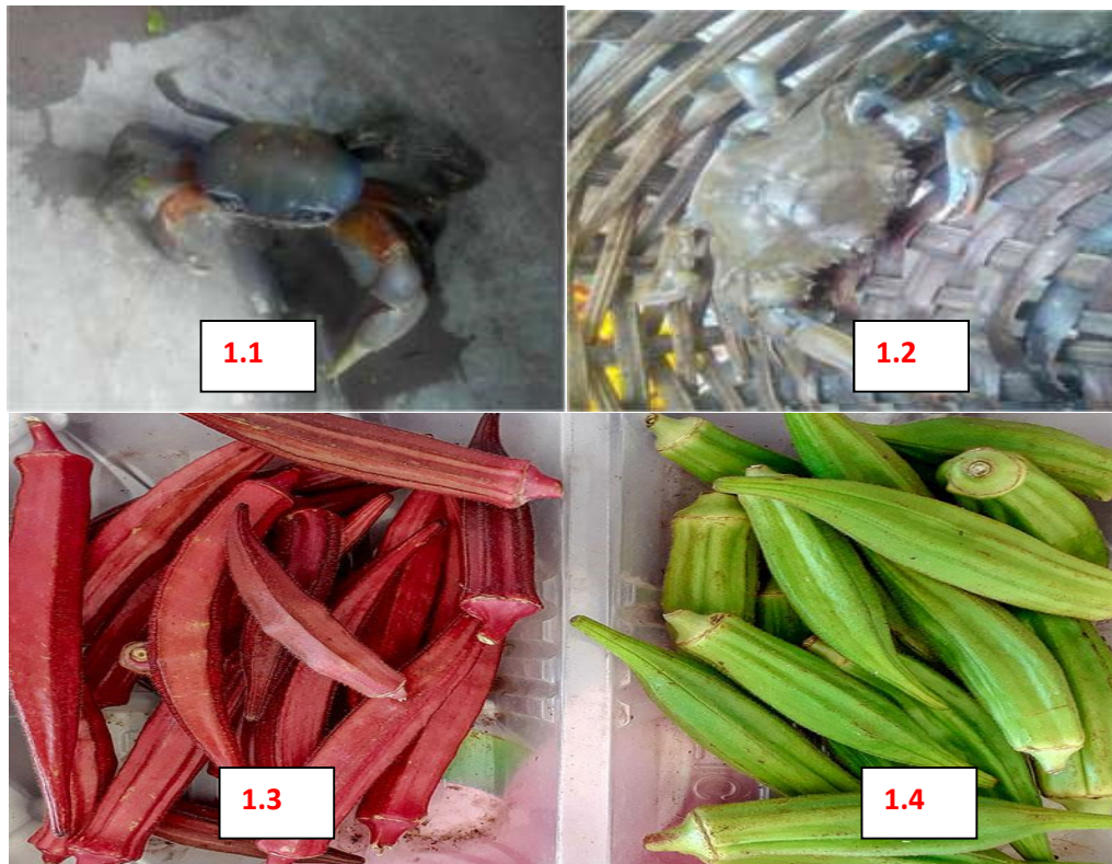
Planche 1 : Callinectes amnicola (1.1) ; Cardisoma armatum (1.2) et Abelmoschus esculentus (gombo variété rouge et verte 1.3, 1.4)