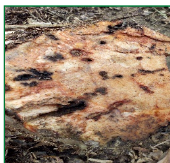
Galeries creuser par des larves du Charançon du bananier