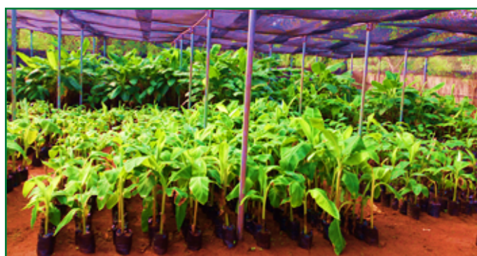
Pied-mère entouré de rejets baïonnettes