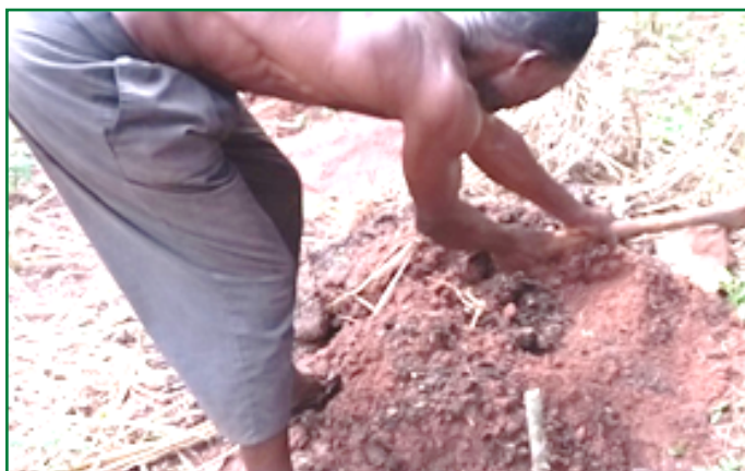
Fumure de fond

NB : En culture sous régime pluviale, mettre les plants en terre en début des pluies en tenant compte du cycle de la variété pour éviter la floraison en saison sèche.