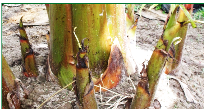
Pied-mère entouré de rejets baïonnettes