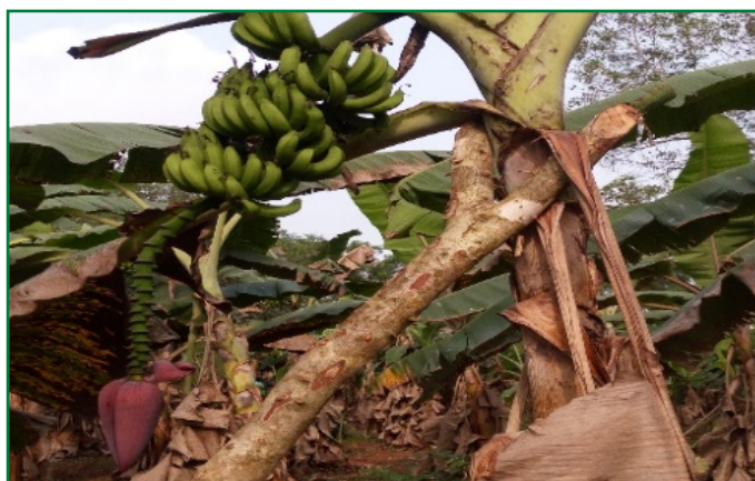
Plant de bananier soutenu par une perche