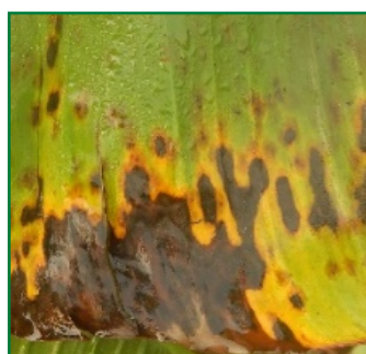
Domage du Cercosporiose noire.