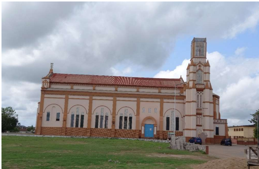
Photo n°3 : Vue de profil de la cathédrale Notre Dame de l'Immaculée Conception

Coordonnées GPS : 6°28'10,75"N et 2°37'3,46"E