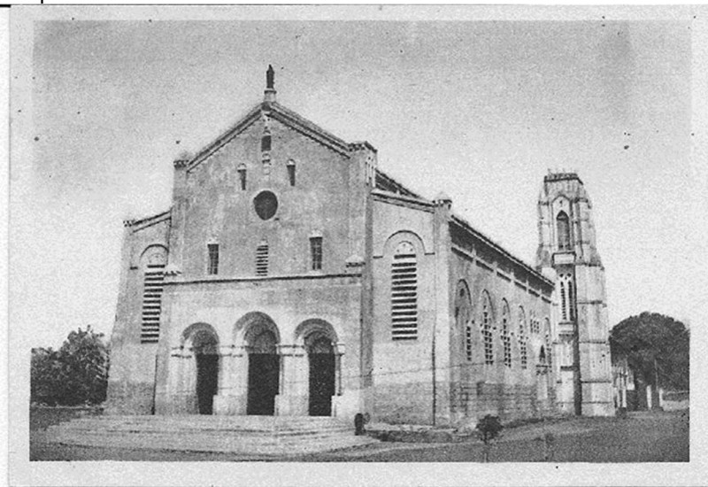
Photo n°1 : Cathédrale Notre Dame de l'Immaculée Conception à son achèvement en 1940

La fin des travaux de la Cathédrale Notre Dame de l'Immaculée Conception dans le prolongement de l'espace qu'occupent l'école secondaire Notre-Dame de Lourdes, le petit séminaire et la résidence, contribua à entériner la destruction du domaine de la forêt sacrée (Photos n° 2 & 3). Ainsi, l'installation de la mission catholique sur un site antérieurement appartenu aux adeptes de la divinité shango répondait bien au besoin d'espace de la montée de la chrétienté dans la ville, dont les anciens bâtiments vétustes ne pouvaient plus contenir les nombreux fidèles. Aussi, l'érection de l'édifice s'est-elle faite surtout pour magnifier la grandeur de la « France conquérante » pendant la période coloniale (D. M. Houénoué et R. Kissoé, 2015, p. 109). Bon gré, mal gré, elle a entraîné la destruction d'une richesse naturelle et historique importante.