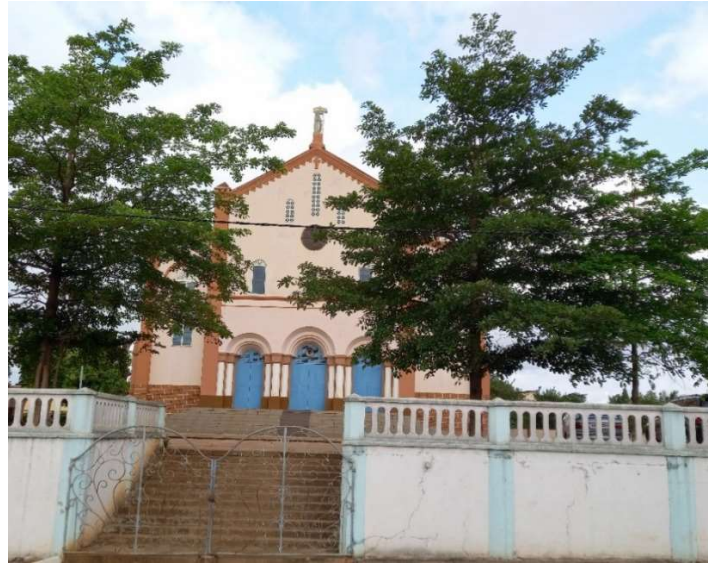
Photo n°2 : Vue de face de Cathédrale Notre Dame de l'Immaculée Conception