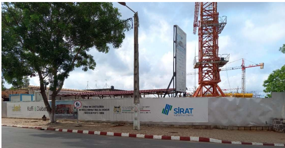
Photo n°4 : Musée international des arts et civilisations vodun en chantier

Dans son Programme d'Actions du Gouvernement (PAG 2016-2021), le pouvoir en place a décidé d'engager le Bénin dans la transformation structurelle de l'économie d'une part, et à améliorer la croissance économique d'autre part. L'axe 4 dudit programme a pour objectif de « faire du tourisme une filière de développement économique créatrice de richesses et d'emplois ». Ainsi, dans le secteur du tourisme et de la culture, Porto-Novo, ville multiséculaire a bénéficié entre autres, de projets en cours d'exécution de construction du musée international des arts et civilisations du vodun/orisha ; de réhabilitation du musée Adandé et du musée Honmè ; et de construction de l'arène culturelle de Porto-Novo. Dans la continuité, le PAG 2021-2026 poursuit ces différents projets. A l'emplacement de l'érection du Musée international des arts et civilisations vodun/orisha (Photo n°4) se trouvait le musée Da Silva avec en son sein la maison Paraiso (Photo n°5). Ce nouveau musée occupe un site d'environ 16000 m 2 . Le projet s'articule autour de 5 espaces majeurs, à savoir un grand bâtiment d'accueil, un auditorium pour 150 personnes, une salle d'exposition temporaire, 4 salles d'exposition permanentes et une zone logistique. La destruction du musée Da Silva constitue une perte pour le patrimoine de la ville de Porto-Novo.