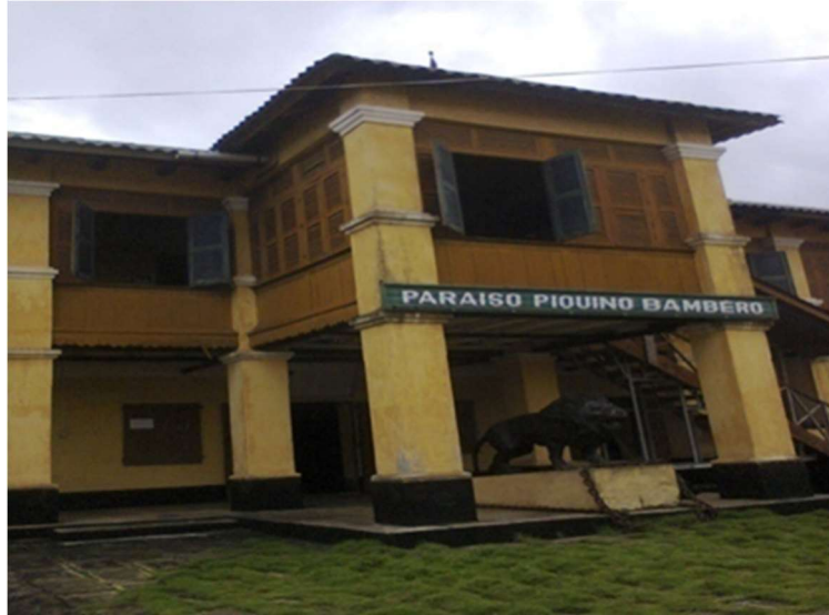
Photo n°5 : Façade principale du bâtiment de Paraíso Piquino Bambero dans l'ancien musée de Porto-Novo, architecture Afro-Brésilienne