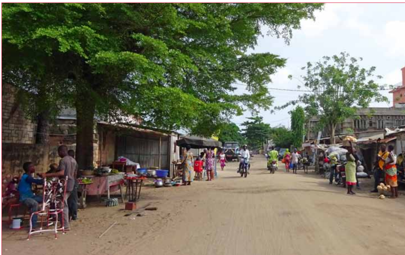
Un quartier populaire de Cotonou. Photo Psy Cause, novembre 2016.

Le passage à l'acte peut constituer un mode d'entrée dans la maladie mentale. Il peut intervenir sous l'influence d'une force inconsciente irrésistible qui conditionne l'individu dans son attitude. Cette force qui peut prendre la forme d'une voix appelées hallucinations auditives ou psychiques en psychiatrie peut aussi être interprétée dans la culture africaine comme étant l'œuvre des esprits mauvais, des Azétos.