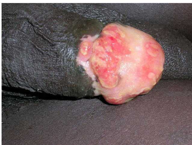
Fig. 1 Ulcération propre bourgeonnante à limites floues, siégeant sur le gland et débordant sur le sillon balano-préputial / Clean burrowing erosion with fuzzy boundary, sitting on the glans and extending into the preputial sulcus

Son aspect est dit évocateur lorsque sa surface est luisante ou brillante, lisse, de couleur rouge-orangé à rouge-marron.