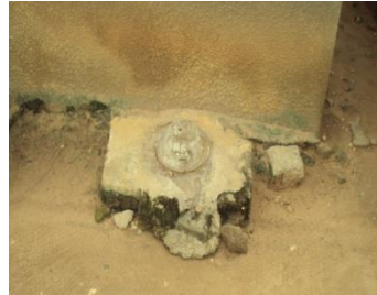
Planche 8 : Entretien avec le premier ministre et_Xwué Lègba à Lokossa, à l'entrée du Palais royal privé