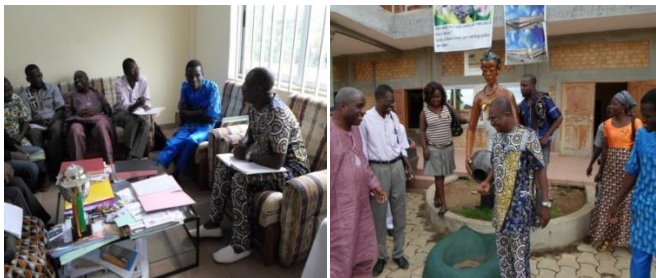
Planche 1 : Séance de travail à l'intérieur et dans la cour de la mairie de Lokossa avec le premier conseiller

Les lieux et hiérarchies sont mis en exergue à travers des illustrations de deux photos qui montrent pour la première, la séance de travail de l'équipe d'ELIJUC avec le représentant du Maire (absent) et du Conseil municipal de Lokossa, et pour la deuxième, la découverte du logo d'accueil de la Mairie : une femme à la rivière qui remplit sa jarre, symbole de l'eau offerte à l'étranger en guise d'acceptation et de sociabilité. Le sens même revient à considérer la mairie comme un service public qui offre l'eau des prestations à tous les demandeurs.