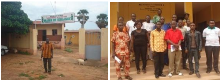
Planche 6 : Les chefs de service de la mairie et la photo de famille

Dans le contexte de Kouandé, une illustration permet de remarquer aussi les membres des services municipaux et la délégation du projet ELIJUC. L'espace a été aussi matérialisé par la porte d'entrée de la Mairie comportant l'insigne de la dénomination de l'hôtel de ville (Cf. planche 6).