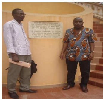
Photo 1 : Le chef de Mission (à droite) et un des encadreurs de la Mission ELIJUC dans la cour de la Mairie

La photo ci-dessous a l'intérêt de présenter le panneau d'information sur l'inauguration des bâtiments neufs de l'Hôtel de ville de Ouidah et des autorités impliquées.