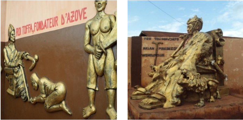
Planche 9 : Les signifiés du pouvoir et un symbole en métal de sa représentation

Sur la devanture du royaume, quelques illustrations imagées expriment les signifiés du pouvoir. Les photos de la planche 9 en donne une idée.