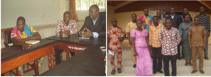
Planche 5 : Représentant du Conseil municipal et chefs de service avec la photo de famille