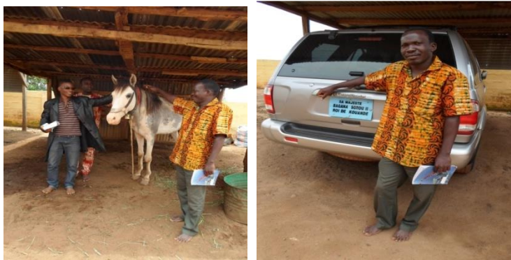
Planche 12 : Cheval et Voiture, deux symboles de pouvoir

Les éléments suivants sont des symboles de pouvoir. Ils rehaussent l'autorité et le distinguent nettement des autres membres de la société. Il s'agit de Cheval et Voiture, mis en exergue dans la planche 12.