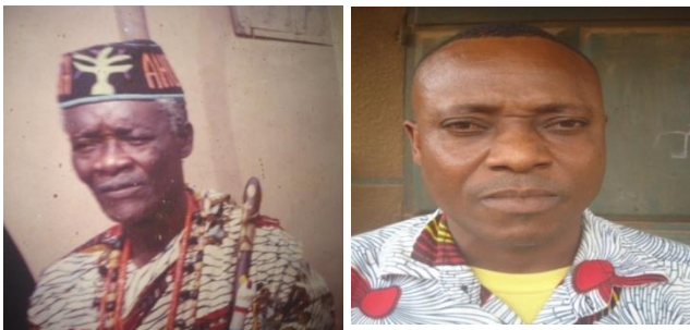
Planche 7 : Photographie du roi HADAGBA Tossè Tossou-Anon de Lokossa et le premier ministre

Le Ahôlou est actuellement dans sa résidence ou palais privé sur un demi-hectare (où s'est déroulé l'entretien). Il y a un ancien palais qui avait été saisi au temps de la Révolution et du Marxisme-léninisme, lorsque le régime du socialiste rouge Mathieu Kérékou a fait la chasse aux autorités endogènes sous les anathèmes de forces réactionnaires, valets et suppôts de la bourgeoisie capitaliste, entre 1972 et 1989 ; c'est ce Palais qui a été transformé en Ecole de base à Agon Vè. La Mairie vient d'affecter deux hectares à la construction du nouveau palais, localisé près des habitations économiques. Il faut composer avec la Préfecture qui vient elle aussi d'ériger un domaine vers l'Evêché. La planche 7 présente la photographie du roi HADAGBA Tossè Tossou-Anon de Lokossa et le premier ministre.