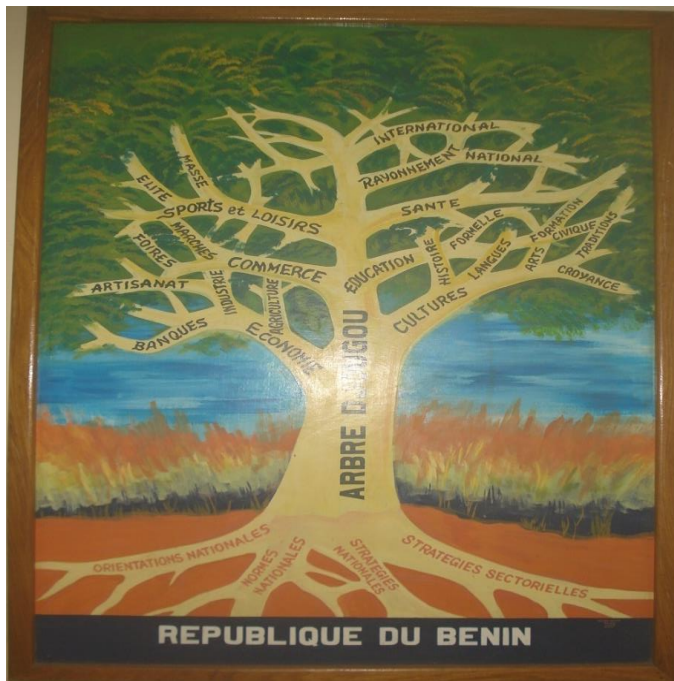
Photo 2 : Le symbole du maillage administratif de la mairie de Djougou

La photo 2 présente l'image arborée d'abord des normes, orientations et stratégies sectorielles de la mairie en interaction avec les services déconcentrés de l'Etat central et le rayonnement national et international de la municipalité