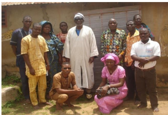
Photo 4: Le roi de Djougou avec les membres de la Mission après l'entretien