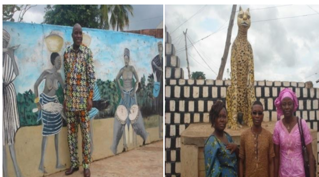
Planche 10 : Le panneau qui montre les tambours de la répression de la corruption et la panthère protectrice de Djougou

Comme plusieurs royaumes et chefferies, les espaces liés aux entrées sont souvent expressives d'images et de décorations. La planche 10 montre quelques-unes dans l'espace intérieur de la cour royale.