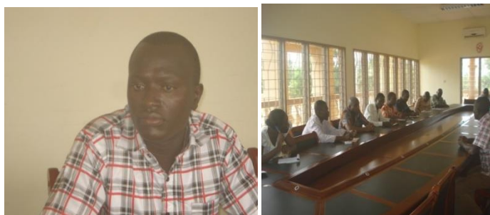
Planche 2 : Un chef de service en séance de travail avec la Mission ELIJUC

Nous avons ci-dessous deux photos qui montrent pour la première, un chef de service de la mairie de Ouidah, et pour la deuxième l'entretien que ce dernier a accordé aux membres de la Mission ELIJUC, dans la salle de conférence de la municipalité.