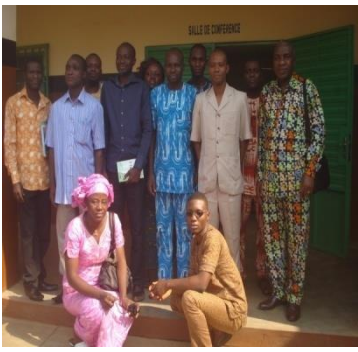
Planche 3 : Prix objets de corruption et une vue après entretien avec deux chefs de service